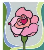
12. September: Mariä Namen