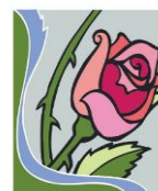
15. September: Mariä Schmerzen