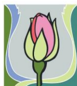
8. September: Mariä Geburt

Es ist nicht selbstverständlich, dass Sie regelmäßig zu unseren Gottesdiensten kommen. Ihr Dasein und Ihre Mitfeier sind uns ganz wichtig. Vielen herzlichen DANK dafür! Das gemeinsame Lob Gottes ist wertvoller als das Gebet einzelner. Wir beten immer auch stellvertretend für jene, die nicht mehr kommen und vielleicht Gott in ihrem Leben verloren haben. Deshalb ist unser Dienst so wichtig.