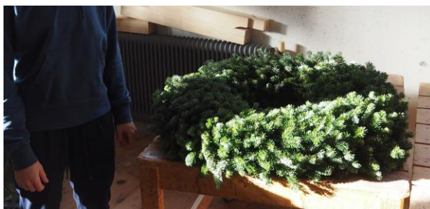
Bleiben wir verbunden!