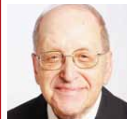
Freude und Erfüllung durch Gottes Gnade und Hilfe sind das tragende Element im priesterlichen Dienst. DOBLER

Dienst als Seelsorger. Mit Gottes Hilfe durfte ich 1962 am Hochfest Peter und Paul in Bregenz - St. Gallus die Priesterweihe empfangen und am Sonntag, dem 8. Juli, in meiner Heimatgemeinde St. Gerold die Primiz feiern. Dann folgten die Jahre im seelsorglichen Dienst als Kaplan in Ludesch, Innerlaterns, Dornbirn Haselstauden, dann 38 Jahre als Pfarrer in Satteins bis zur Pensionierung im vergangenen Jahr. Auch im Dienst eines Priesters gibt es Höhen und Tiefen, aber Freude und Erfüllung durch Gottes Gnade und Hilfe sind das tragende Element.