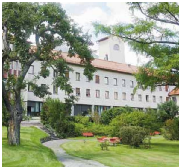
Das Priesterseminar in Innsbruck. PRIESTERSEMINAR

Wirklich hören bedeutet: Spüren, empfinden, innerwerden, betroffen sein. Wer zuhört, der ist auf dem Weg, die Gesprächspartnerin, den Gesprächspartner zu verstehen. „Verstehen“ heißt der Wortbedeutung nach „dort stehen, wo der andere steht“. Versetze ich mich im Gespräch in die/den anderen hinein, was nie ganz möglich ist, fühlt sich jene/r verstanden, weil ich ihr/ihm nahe bin und sie/er nicht mehr allein ist. Nicht verstanden sein führt zur Einsamkeit; verstehen und verstanden werden bedeutet Gemeinschaft. Wenn jemand sagt: „Ich glaube, du verstehst mich“, so ist das ein großes Kompliment. Wo wir wirklich zuhören, nehmen wir teil an der „Freude und Hoffnung, an der Trauer und Angst der Menschen“ (GS 1); da geschieht Erlösung von Aussichtslosigkeit, Einsamkeit, Not, Schmerz und Leid.