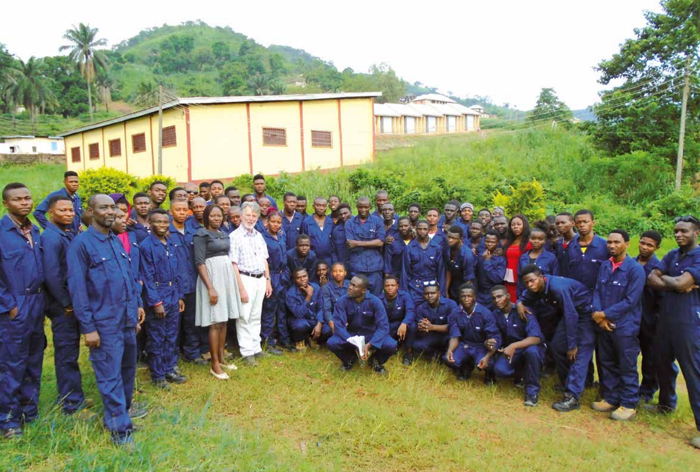
Stolz und interessiert zeigen sich Lehrlinge und Ausbilder des VTTC Enugu Stand Juni 2019