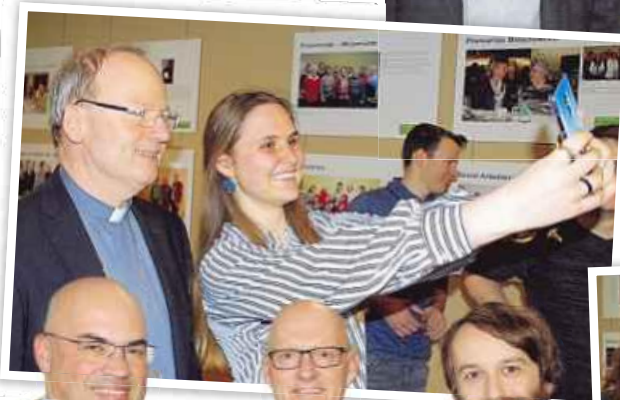
⊙ Erinnerung-Selfie mit Bischof und Autor Elbs.