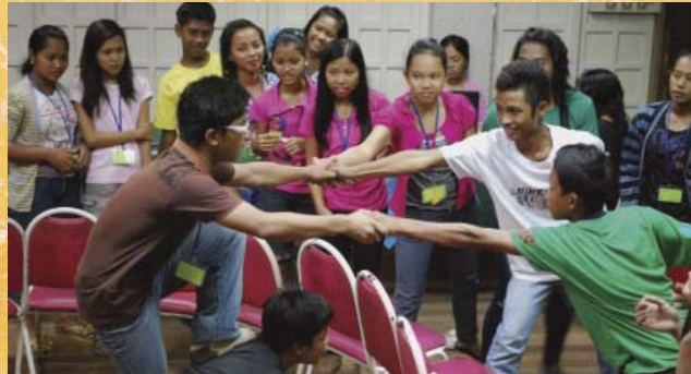
Stärkung des Selbstvertrauens von Kindern und Jugendlichen Davao, Philippinen