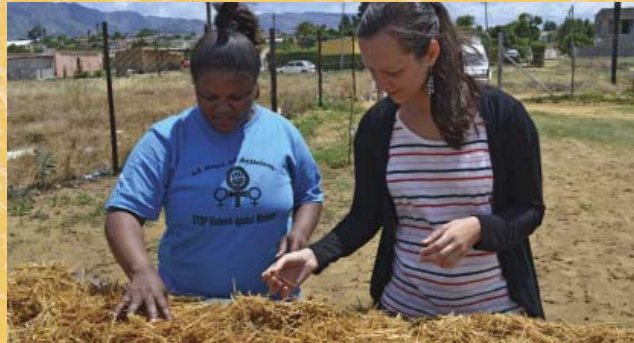
Unterstützung von Farmerinnen bei ihrer Selbstorganisation Stellenbosch, Südafrika