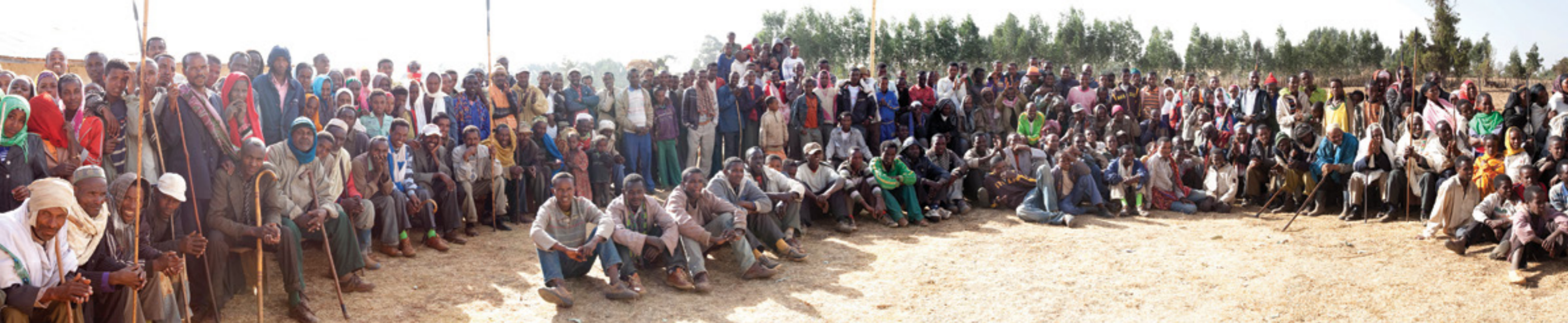
EMPFANG IN QARSSA DKA / IONIAN