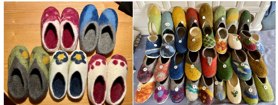
Diese wunderschönen Filzpatschen werden am Adventbasar verkauft