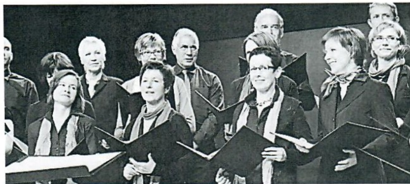
Adventsingen mit dem Magnus Chor.

Unsere Sternsinger sind auch heuer wieder vom 03. bis 06. Jänner unterwegs zu ihnen nach Hause, um für einen guten Zweck zu sammeln. Die Firmlinge und das Firm-Team hoffen auf ihre großzügige Unterstützung. Die Sternsinger bringen euch den Segen ins Haus!