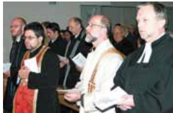
Der Gottesdienst zählt bereits zur Tradition. ÖKUMENE-KOMMISSION

Die römisch-katholische Kirche, die evangelischen Gemeinden, die serbisch-orthodoxe und rumänisch-orthodoxe sowie die altkatholische Kirche feiern und gestalten gemeinsam mit der evangelisch-methodistischen Kirche bereits zum vierten Mal in Lustenau einen ökumenischen Abendgottesdienst. Rituale und Elemente aus den verschiedenen christlichen Traditionen finden darin Eingang und lassen die Vielfalt christlicher Liturgien erahnen. Musikalisch wird