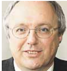
Bischof Michael Bünker fordert Sozialverträglichkeitsprüfung. EPD.

■ Sozial verträglich. Der evangelische Bischof Michael Bünker hat sich für die Einführung einer Sozialverträglichkeitsprüfung ausgesprochen. Bereits die Maßnahmen zum derzeit geplanten Sparpaket könnten