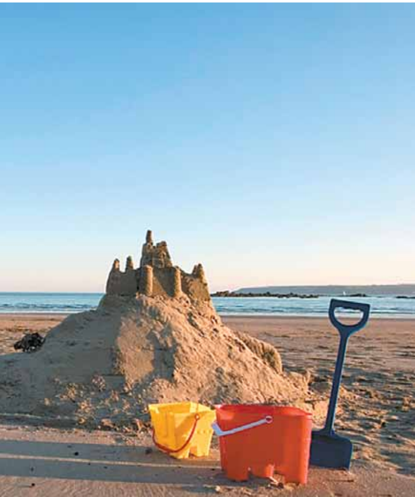
Ein Anblick der zum Schauen und Spielen einlädt. St Michaels Mount einmal in echt einmal als Sandburg