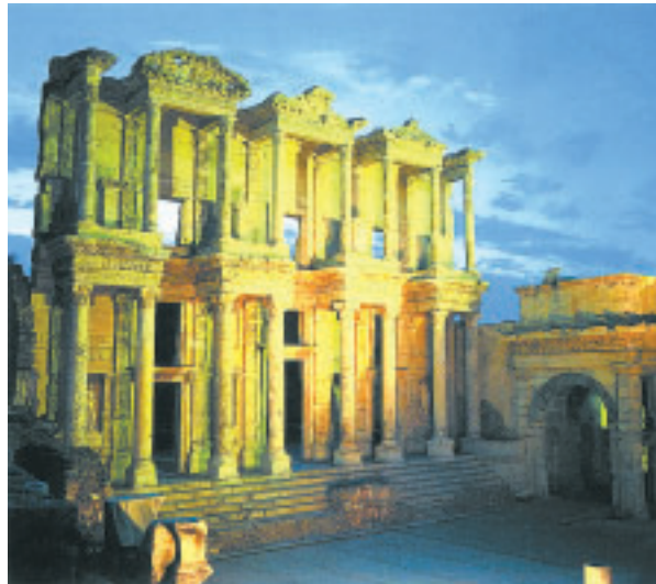
Ephesus zählte zur Zeit des Apostels Paulus zu den Metropolen des Mittelmeerraums. Der Apostel machte dort zwei Mal auf seinen Missionsreisen Station. Die Reste aus der Zeit der Antike sind beeindruckend. KIRCHENZEITUNG