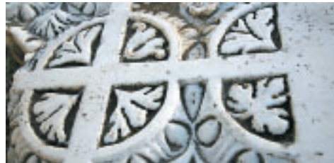
Christliche Signaturen in Perge FC

4. Tag: Pergamon, Thyatira, Magnesia - Fahrt über das antike Smyrna (Off 2,8-11) Richtung Norden nach Pergamon (Offb 2,12-17). Be-