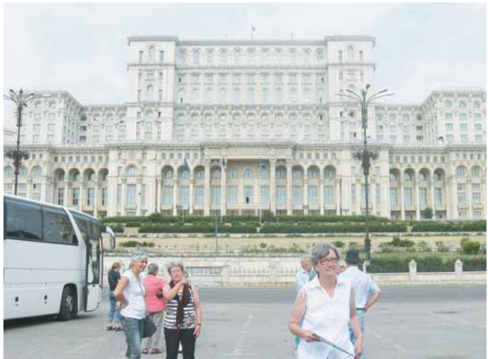
Am letzten Tag der Reise standen die Sehenswürdigkeiten von Bukarest im Mittelpunkt der Besichtigungen.