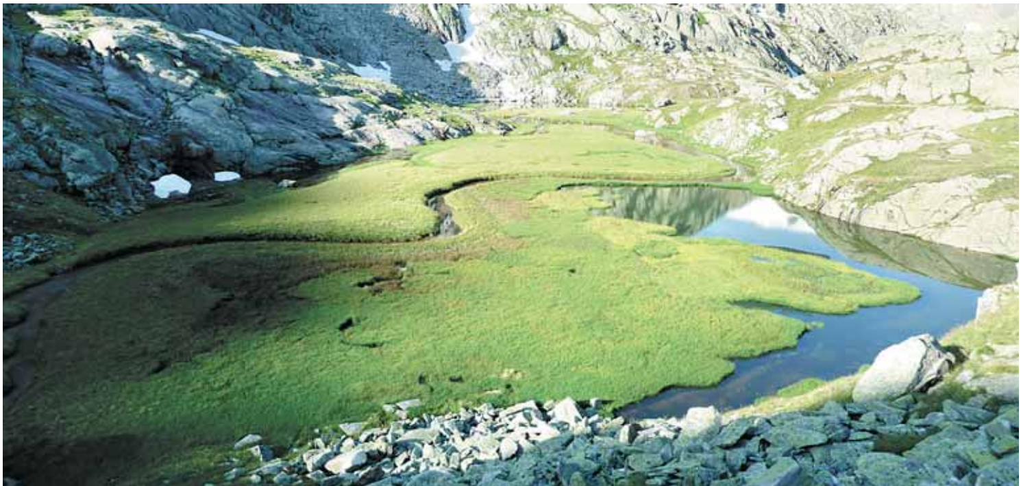
Gegensätze im Hochgebirge: Das Paradies in den Stubaier Alpen ist ein sanfter Kraftplatz mitten im schroffen Fels.

in ca. eineinhalb Stunden von der Hütte aus erreicht wird. Für längere Aufenthalte bietet die Nürnberger Hütte 130 Schlafplätze.