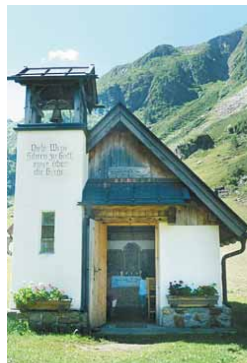
Kapelle bei der B'suchalm: Der Spruch auf dem Turm ist ein erster Hinweis auf das Paradies, das den Wanderer im Hochgebirge erwartet.