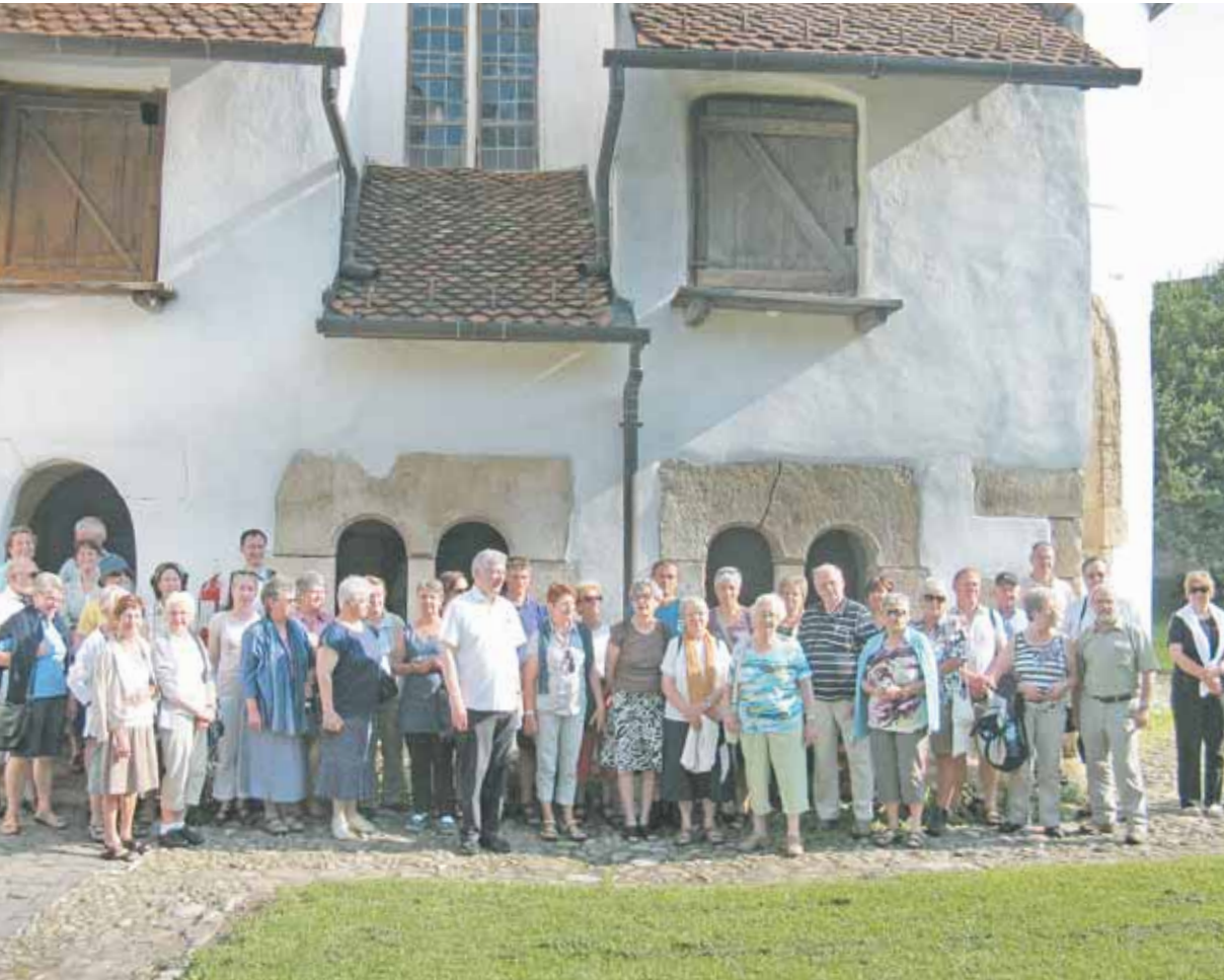
Die besichtigten Kirchenburgen sind immer noch Zeuge einer gewaltvollen Vergangenheit. Die Reisetilnehmer/innen waren entsprechend beeindruckt.