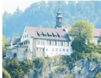
Die Kirche am Gebhardsberg lädt zu Gebet und Eucharistie. MATHIS

Der Gebhardsberg bietet einen wunderbaren Ausblick über den Bodensee und das Vorarlberger Unterland. Jedes Jahr feiert die Diözese Feldkirch hier ihren Patron, der vor allem in der Landeshauptstadt Bregenz verehrt wird. Der heilige Bischof Gebhard gilt als Brückenbauer im Bodenseeraum. Das Hochaltarbild zeigt die Geburt des heiligen Gebhard, der auch in Geburtsfragen angerufen werden kann. Die Wallfahrt zu ihm gilt vor allem aber auch allen Anliegen der Diözese.