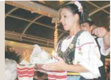
Folklore Darbietungen überraschten am letzten Abend.