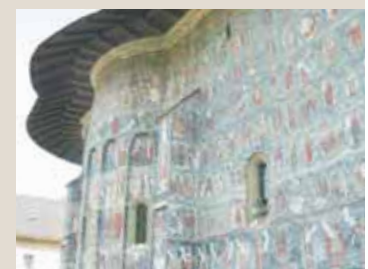
Einmalige Freskenmalereien sind heute noch im Original erhalten.