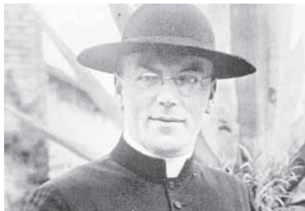
Provikar Carl Lampert wird am 13. November 2011 in Dornbirn seliggesprochen.