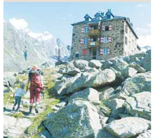
Die Nürnberger Hütte ist ein familienfreundlicher Ausgangspunkt für Wanderungen und Bergtouren am Stubaier Hauptkamm.