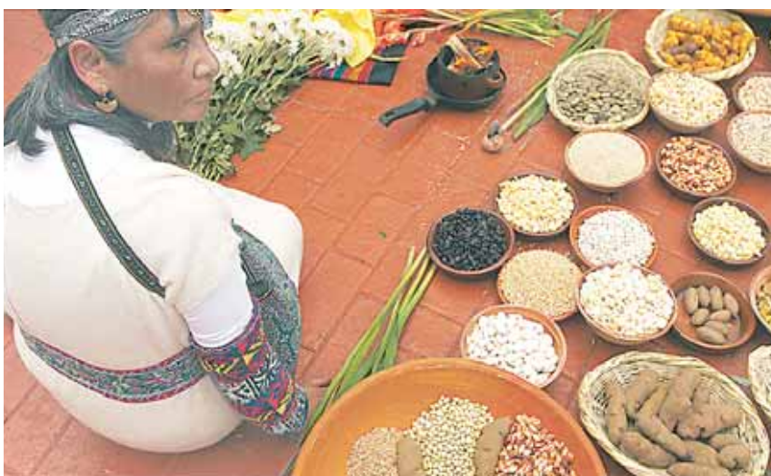
Die Wiedereinsetzung und Nutzung von einheimischem Saatgut soll Kleinbauern in Lateinamerika und Afrika unabhängig machen von teuren Saatgutherstellern.