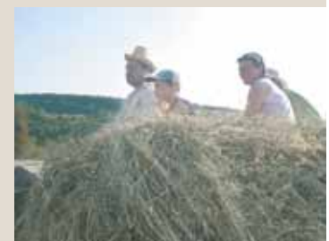
Pferdefuhrwerke sind immer noch am Land im Einsatz.