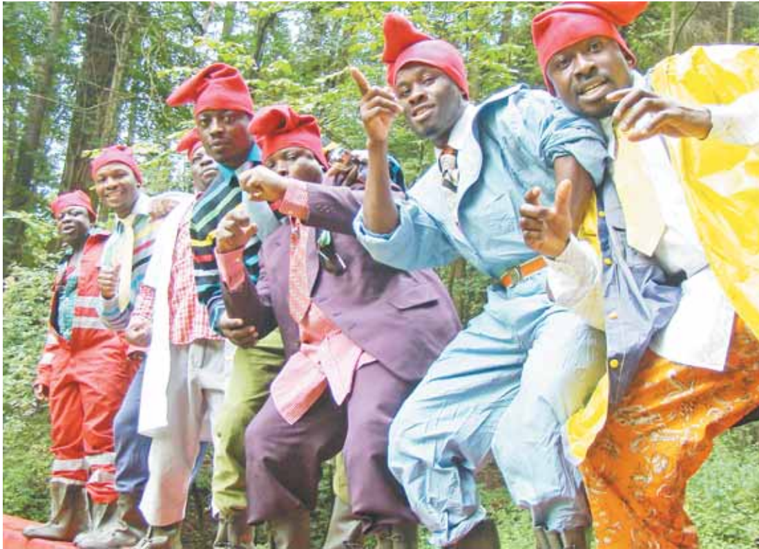
Die sieben Zwerge. Eine Besonderheit des Walk-Tanztheaters ist die Zusammenarbeit von Theater-Profis, Laiendarstellern und Asylanten, die hier eine Bühne für ihre Kreativität finden.