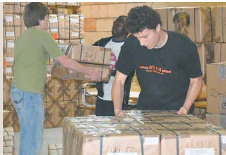
Anschließend werden die Medikamente verpackt und versendet. FELIZETER (2)