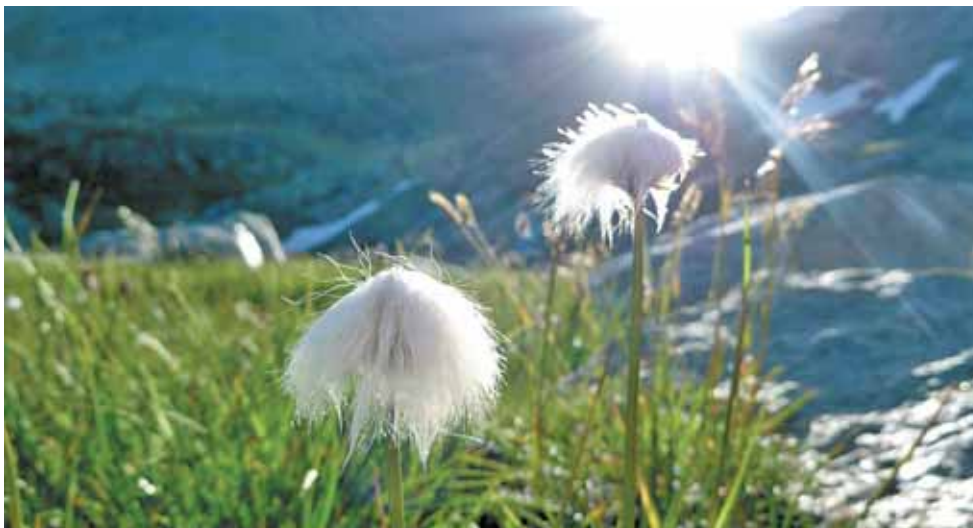
Am frühen Morgen hat sich das Wollgras noch nicht voll entfaltet. HÖBLING (5)