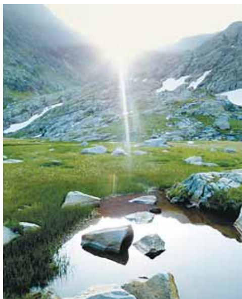
Sonnenaufgang im Paradies in den Bergen.