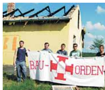
Der Bauorden hilft helfen. Dazu braucht er dringend Freiwillige. ► Alle Infos: www.bauorden.at BO

Der Österreichische Bauorden sucht für die Monate August, September und Oktober noch freiwillige Helfer/innen (ab 18 Jahre). Erwartet wird die Bereitschaft, in international zusammengesetzten Gruppen beim Ausbau sozialer Einrichtungen Hand anzulegen. Geboten werden neben der Unterbringung und Verpflegung das Erleben von Kameradschaft und das Kennenlernen von Land und Leuten abseits der Touristenpfade. Unter anderem sollen ein „Kindergarten der Hoffnung“ in Albanien, Behinderteneinrichtungen in Belgien, Jugendbegegnungsstätten in Deutschland und ein Kinderheim in Griechenland ausgebaut werden.