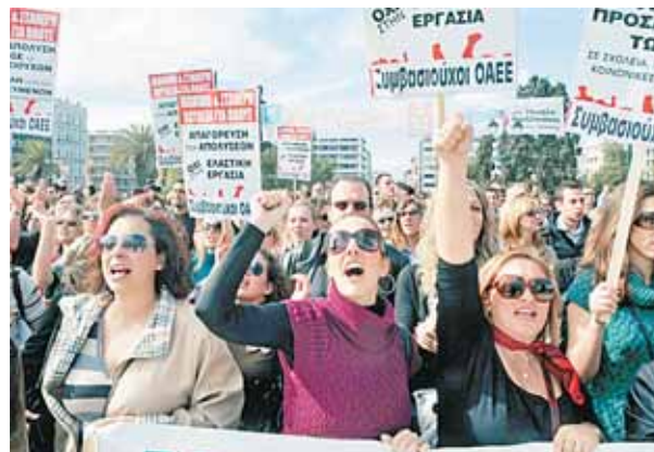
Proteste in Griechenland: Wer zahlt für die „Schuld“ der Verschuldung. Bisher nicht die Reichen. L. GOULIAMAKI

Zehn Jahre nach dem Terroranschlag in New York, der die Welt verändert hat, wollten sich die diesjährigen Salzburger Hochschulwochen der spannungsgeladenen Thematik „Sicher. Unsicher“ stellen. Aktuelle Ereignisse wie die Schuldenkrise, die Hungerkatastrophe in Ostafrika, die Reaktorkatastrophe von Fukushima oder der Terroranschlag in Norwegen, aber auch die durch Missbrauchsskandale ausgelöste Vertrauenskrise in der Kirche sorgten für eine ungeplante Brisanz.