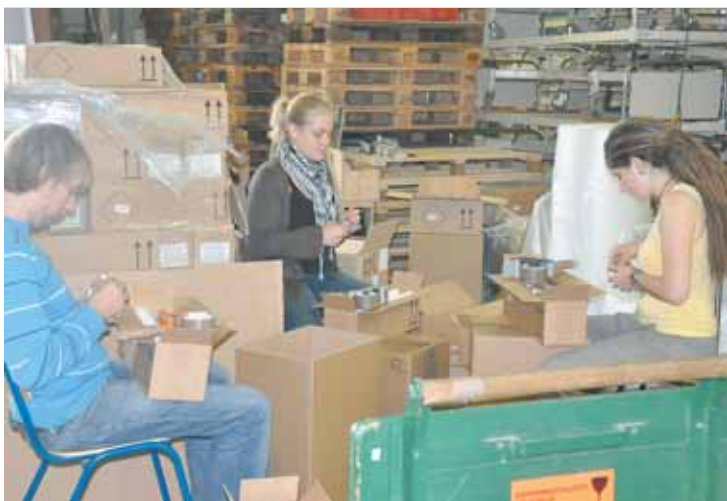
Zahlreiche Ferialarbeiter helfen beim Sortieren der Medikamente.