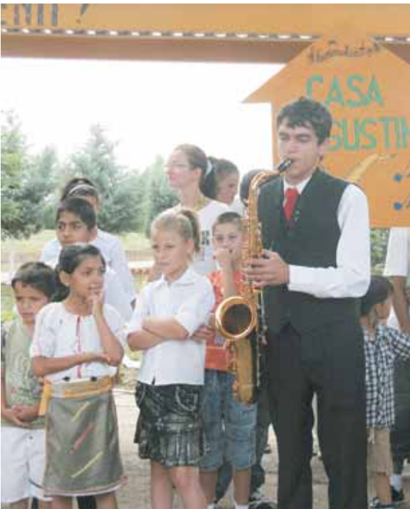
Die Gruppe wurde in Rumänien herzlich und musikalisch begrüßt.