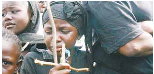
In Jos sind immer mehr Kinder und Frauen gezielten Anschlägen ausgesetzt.