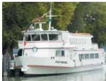
Rund 3500 Pilger sind jährlich bei der Schiffsprozession dabei.