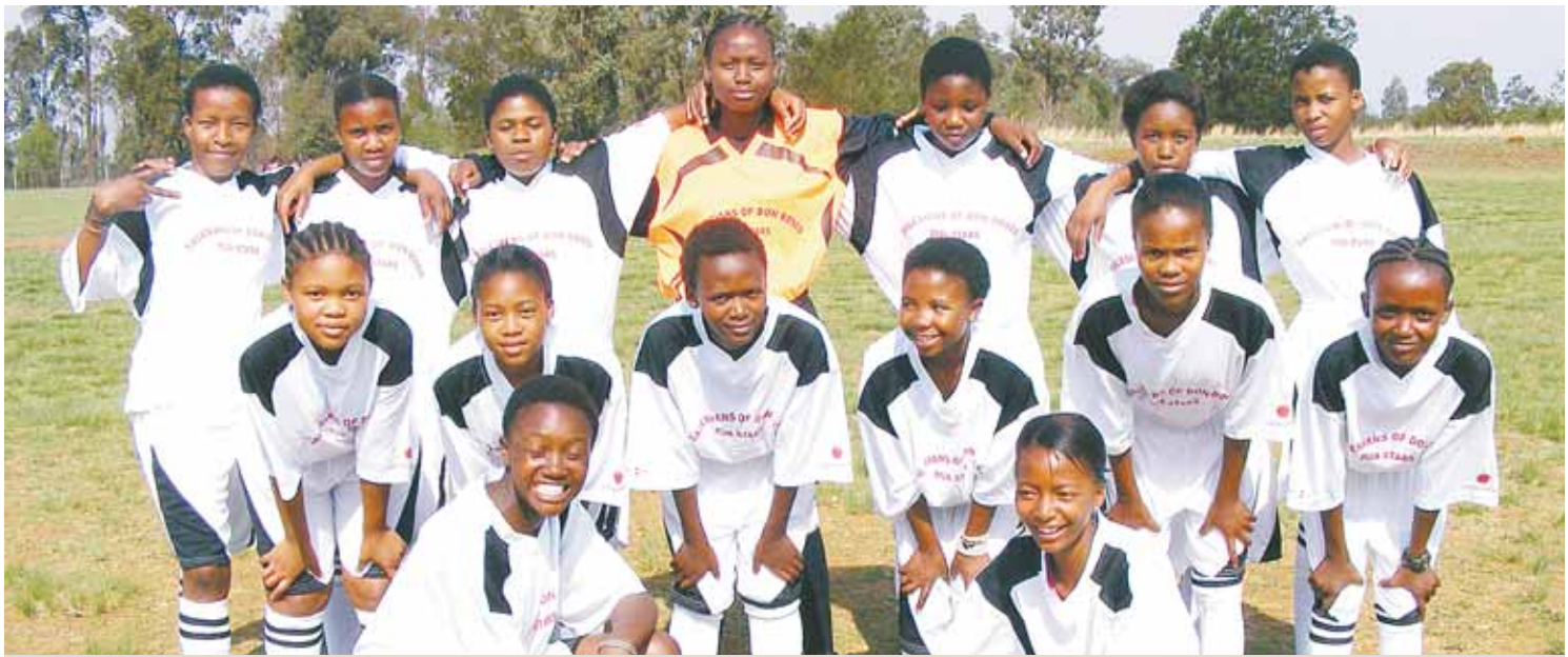
Die südafrikanische Mädchen-Fußballmannschaft „Michael Rua Stars“ wird vom Hilfswerk „Jugend Eine Welt“ unterstützt.