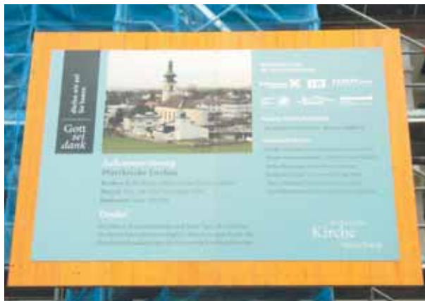
Die Bautafel an der Kirche in Lochau. FELIZETER

Jährlich werden in den Pfarren unserer Diözese etwa zehn bis fünfzehn Bauvorhaben realisiert. Seit Mai 2011 gehört auch die Franz Xaver Kirche in Lochau dazu. Damit das auch für jeden auf einen Blick ersichtlich ist, wurde an der Kirche die erste „Bautafel für kirchliche Bauvorhaben“ angebracht. Sie soll die Bevölkerung über die wesentlichen Baudaten wie beispielsweise Bauherr, -zeit und -kosten informieren. Im Fall der Kirche in Lochau wären dies die Katholische Pfarre Franz Xaver, die im Zeitraum von Mai bis November 2011 insgesamt 410.000 Euro für die Außenrenovierung aufwendet. Dank der einheitlichen Gestaltung der Bautafeln kann jeder gleich sehen, dass das Bauamt der Diözese Feldkirch die örtliche Bauaufsicht innehat und welche Firmen mit der Ausführung betraut sind.