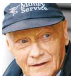
Niki Lauda wird in die katholische Kirche wieder eintreten.

■ Wiedereintritt. Der frühere österreichische Formel-1-Weltmeister Niki Lauda möchte wieder in die katholische Kirche eintreten. Anlass dafür ist die Geburt seiner