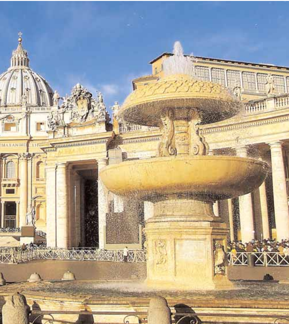
Der Petersdom , Zentrum der katholischen Christenheit und eines der bedeutendsten Pilgerziele der Welt.