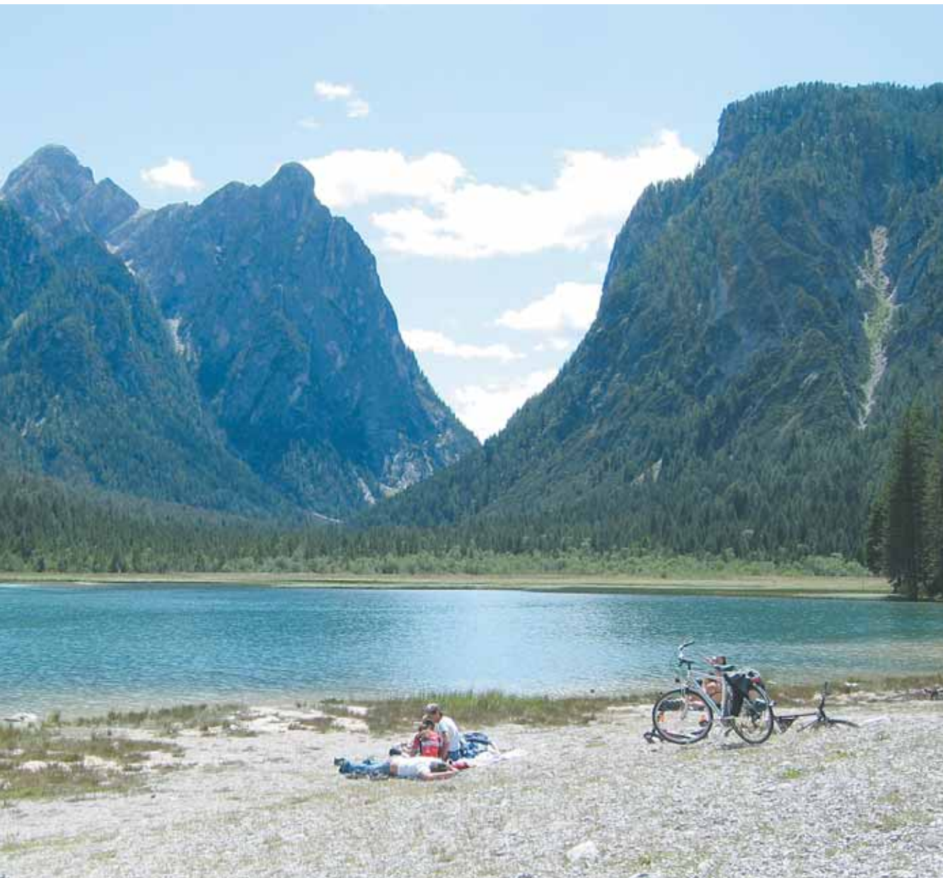
DER TOBLACHER SEE IM SÜDTIROLER HÖHLENSTEINTAL

2 Kirche Kreativ. Der Künstler-Gottesdienst in der „Offenen Kirche“ am LKH Bregenz.