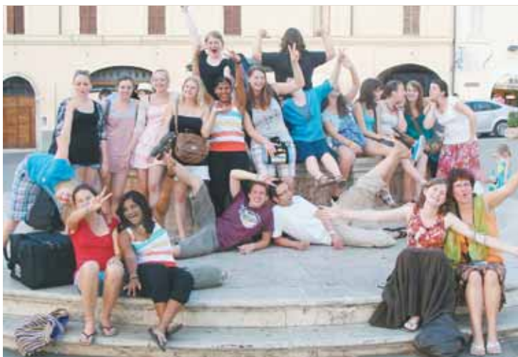
24 Teilnehmer/innen aus Thüringen und Umgebung in Assisi SUTTER (2)