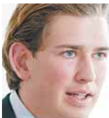
Staatssekretär Sebastian Kurz betonte, dass der Katholischen Aktion beim notwendigen Abbau von Vorurteilen eine wichtige Rolle zukomme.