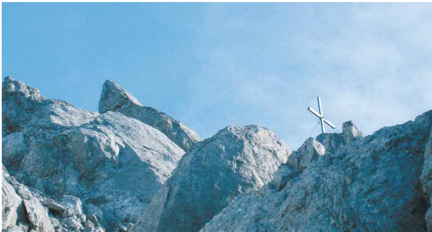
Wer auf den Gipfel eines Berges steigt, kann erfahren, dass sich die Welt in einem ganz neuen Licht zeigt: Verwandlung. KIZ/HUBER

ZEIT.WORT – VON P. ANSELM GRÜN - MONATLICH IM KIRCHENBLATT