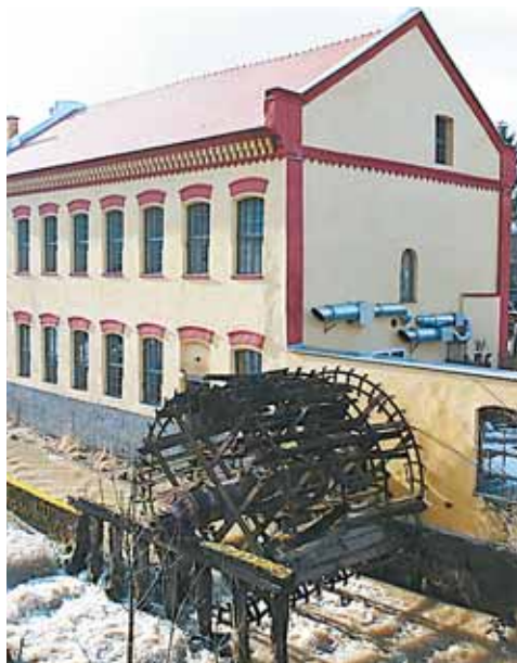
Im Fabriksgebäude von Josef Werndl lädt heute das „Café Drahtzug“ zur Rast.

Der „Himmel auf Erden“ sagen wir, wenn wir Glück empfinden. Manche Menschen leben ständig in einem Himmel, weil der Ort oder die Gegend, in der sie leben, den „Himmel“ im Namen trägt. In diesem Sommer stellen wir einige „Himmelreiche“ vor.