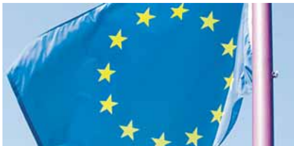
Ein Internet-Projekt der Katholischen Arbeitnehmer will die Meinungsbildung und Beteiligung an der EU stärken. WALDHÄUSL

An EU-Themen beteiligen. Im virtuellen EU-Parlament können sich die Internetnutzer informieren, Kommentare und Reden zu Europathemen abgeben und nicht zuletzt auch darüber abstimmen. Ausgangspunkt der Initiative ist die Überlegung, „dass die Zukunft Europas nicht allein in Brüssel entschieden werden sollte“, sagen die Initiatoren des Inter-