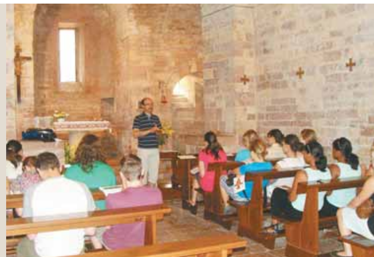
Die Besichtigung der Kirche wurde für ein spontanes Gebet genutzt.