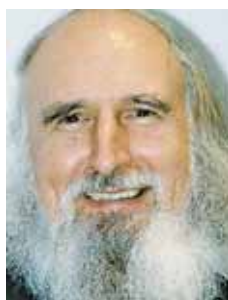
P. Anselm Grün mit monatlichen Impulsen im KirchenBlatt.

Und wir feiern unsere Verwandlung in der Hoffnung, dass Gott nicht nur uns, sondern die ganze Welt immer mehr verwandele und mit dem Geist Jesu durchdringe. Teilhard de Chardin nennt das „Amorisation“, Durchdringung der Welt mit der Liebe Jesu Christi. Dann können wir überall Christi Liebe erleben: in der Natur, im Antlitz eines Menschen, in der Schönheit der Schöpfung.