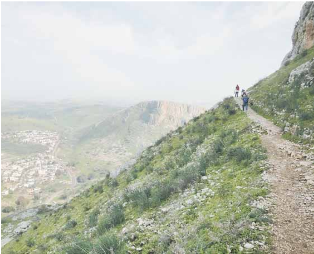
Immer wieder atemberaubende Ausblicke auf dem Jesus-Weg durch Galiläa.

nend als Christin diese Welten zu Fuß zu durchschreiten. Sehr bereichernd waren die Small-Talks und Begegnungen mit Menschen mit den unterschiedlichsten Hintergründen. In Sepphoris trafen wir auf die antiken Kulturen der Ägypter, Griechen und Römer, die damals auch in dieser Multikultiwelt lebten, die mich faszinierte.