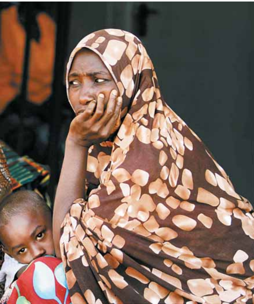
Frauen im nigerianischen Jos sind der Gewalt müde.