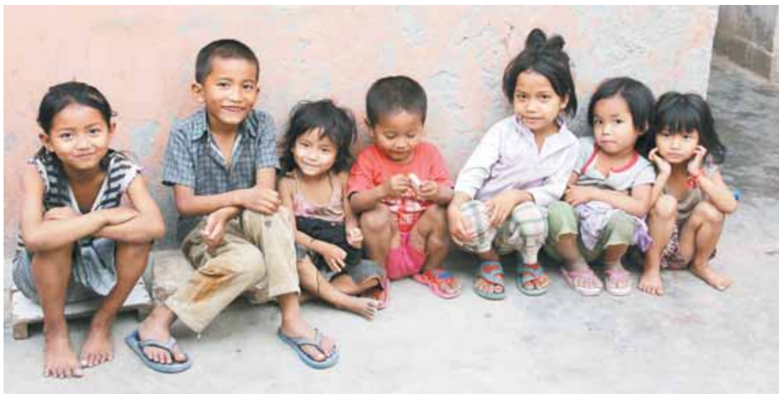
Burmesische Flüchtlingskinder warten noch immer auf ihre Rechte: Nahrung, Wasser, Bildung, Gesundheit.