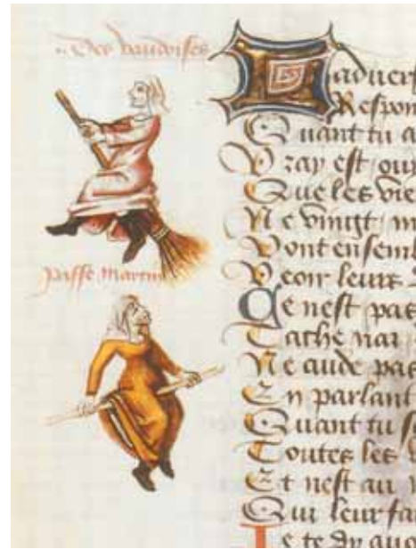
Miniatur in einer Handschrift von Martin Le France.

vorkommen, die den Menschen Streiche spielen, ihnen dadurch aber auch Einsichten in ihr Leben vermitteln. Im christlichen Kontext hat sich diese Figur als „Hofnarr“ erhalten. Er ist keine Frau mehr, aber ihm war es erlaubt, dem König zu zeigen, wo seine (Staats)Ordnung unweise und lebensfeindlich ist.