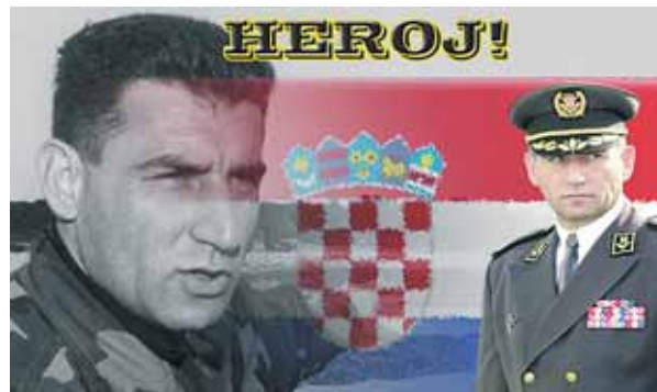
General Ante Gotovina: Seine Verurteilung spaltet das Land und die Kirche und macht den Beitritt zur EU fraglich. KIZ/A

Frankreich, hingegen bremsen und fordern eine größere Kooperation Kroatiens mit dem Internationalen Strafgerichtshof bei der Aufarbeitung der eigenen Kriegsvergangenheit. So empört in Kroatien derzeit die Verurteilung der beiden Militärs Ante Govinda und Mladen Markac vor dem UNO-Kriegsverbrechertribunal in Den Haag die Gemüter. Die im eigenen Land als Kriegshelden verehrten Männer wurden wegen der „Beteiligung an einer kriminellen Vereinigung“, die systematisch Verbrechen gegen die Menschlichkeit im Zusammenhang mit der Rückeroberung der Krajina im Jahr 1995 begangen habe, zu langen Haftstrafen verurteilt. Das Urteil hat selbst die katholische Kirche gespalten: Kritik am Haager Urteil kam nicht zuletzt von der Bischofskonferenz, während andere Teile der Kirche die Kooperation mit Den Haag befürworteten.