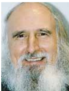
P. Anselm Grün mit monatlichen Impulsen im KirchenBlatt.

Achtsam. Pfingsten als Sprachereignis ist die Herausforderung, auf unsere Sprache zu achten. Von der Sprache Jesu sagten die Jünger: „Brannte nicht unser Herz in der Brust, als er unterwegs mit uns redete?“ (Lk 24, 32) Lernen wir von Jesus und durch den Geist, den er uns sendet, so zu sprechen, dass wir die Herzen berühren. Mit den Worten bauen wir ein Haus, sagen die Kirchenväter. Bauen wir ein Haus, in dem die Menschen sich zuhause fühlen, in dem sie sich wärmen können, sich verstanden fühlen, um so mit ihrer Sprache diese Welt zu verändern und sie mit dem Geist Jesu zu erfüllen.