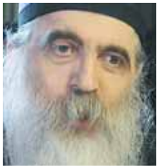
Bischof Irinej leitet die neue serbische Diözese von Wien. RUPPRECHT

■ Neue Diözese. Die Bischofsynode der serbisch-orthodoxen Kirche hat vergangene Woche die Errichtung einer neuen Diözese für Österreich, die Schweiz