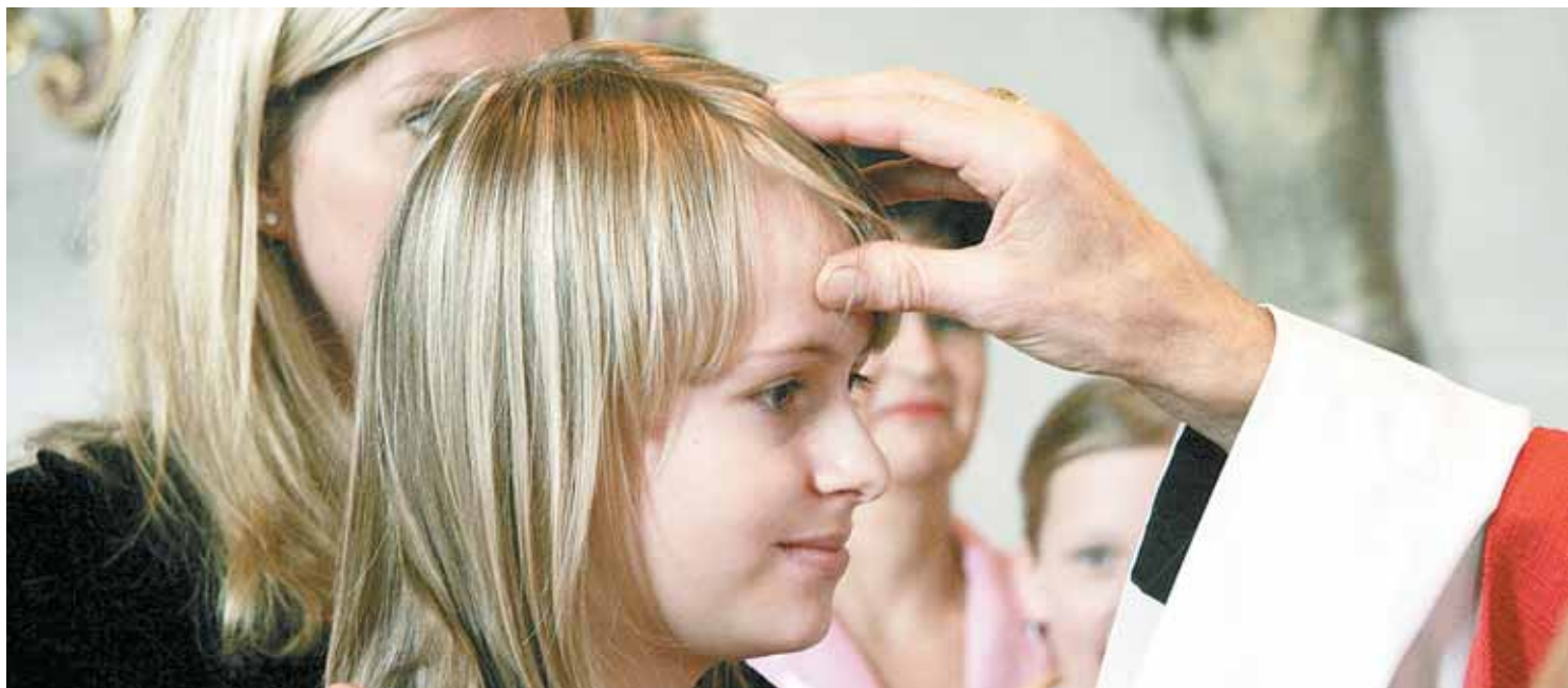
„Sei besiegelt durch die Gabe Gottes, den Heiligen Geist!“ So spricht der Firmspender den jungen Menschen den Geist Gottes zu. Es folgt die Salbung mit Chrisam und das Kreuzzeichen. MATHIS

reitung, in der dem Firmteam der Spagat zwischen christlichen Glaubensinhalten und dem Eingehen auf die Lebenswelt der Jugendlichen gut gelungen ist.