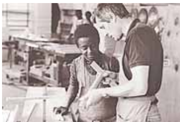
Personelle EZA in den 70er Jahren in Kenia.

Seit Beginn der personellen Entwicklungszusammenarbeit (EZA) vor 50 Jahren sind mehr als 2400 österreichische Fachkräfte in mehr als 80 Staaten der Welt im Einsatz gewesen. Sehr früh kristallisierte sich das Schwerpunktland Papua-Neuguinea heraus, in dem die meisten Einsätze zu verzeichnen waren. An zweiter Stelle lag Nicaragua, gefolgt von Simbabwe. Weitere Einsatzländer waren Ecuador, Bolivien, Kenia und Tansania. Heute konzentriert sich die EZA auf die Regionen südliches und östliches Afrika – vor allem auf die Länder Uganda und Mosambik –, sowie auf Papua-Neuguinea. Derzeit sind rund 80 Projektmitarbeiter/innen in neun Partnerländern im Einsatz, um Hilfe zur Selbsthilfe zu leisten. Das ist der niedrigste Stand bisher und zeigt, dass auch die EZA von Budgetkürzungen stark betroffen ist. Trotzdem ist das Interesse der Österreicher/innen an einem zweijährigen Auslandseinsatz nach