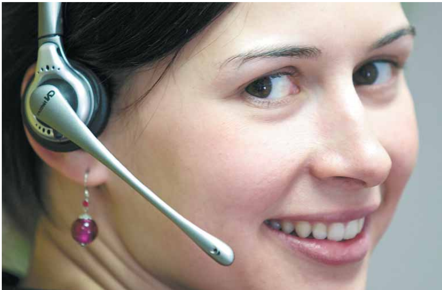
Sprache. Ob wir skypen, telefonieren, predigen oder einfach nur reden: Es kommt auf die Sprache an. Sie zeigt auch, ob und wie wir glauben. WALDHÄUSL

ZEIT.WORT – VON P. ANSELM GRÜN – MONATLICH IM KIRCHENBLATT