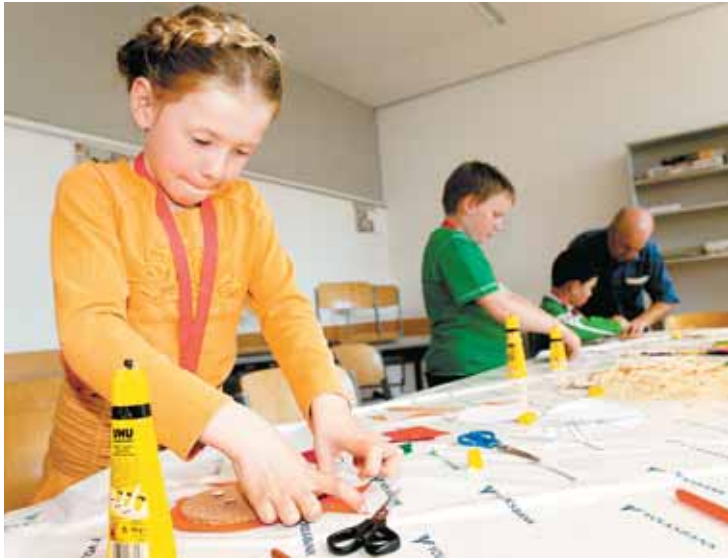
Mit viel Spaß und sichtbarem Eifer machten sich die Kinder ans Basteln.