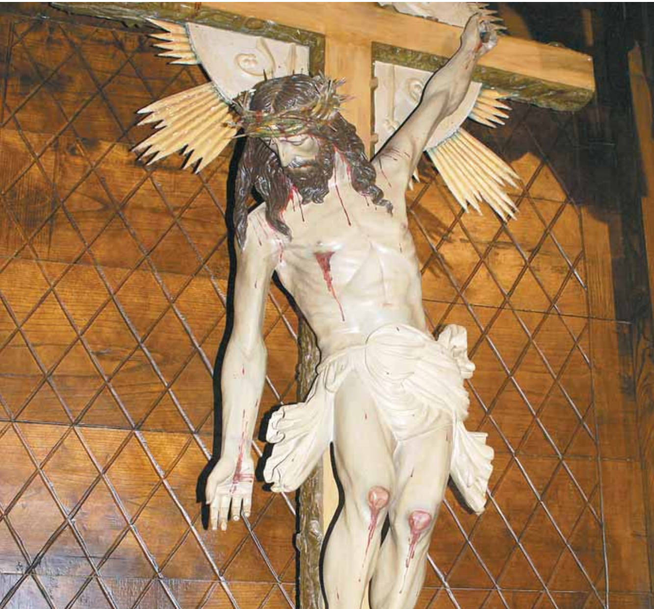
GIOVANNI SEGANTINI, BÜNDNERIN AM BRUNNEN, 1887, SEGANTINI-MUSEUM, ST. MORITZ

2 Was geschieht mit meinem Geld? Möglichkeiten, Geld ethisch anzulegen.