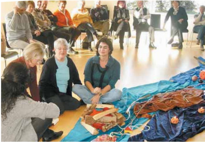
Quellen des Lebens in den Wüsten des Alltags - das Vertrauen in die Gemeinschaft stärkt das eigene Unterwegssein.