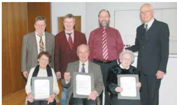
Es sind genau diese geehrten Menschen, die jahraus jahrein der Kirche ihre Talente zur Verfügung stellen und dadurch für alle Christus ein menschenfreundliches Gesicht geben.