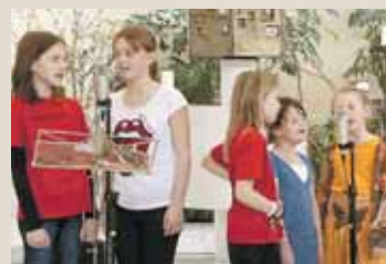
Die musikalische „Frechdax“-Gruppe gestaltete die Messe.