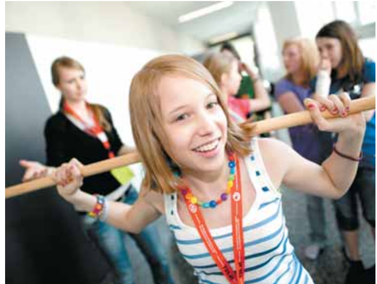
„Hoppla, das ist ganz schön schwer!“ - Dass Wasser ein kostbares und vor allem schweres Gut ist, ließ sich beim spielerischen Wassertragen erfahren.