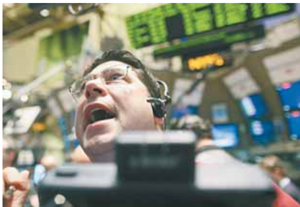
Die Finanztransaktionssteuer soll Spekulanten bremsen. Seriöse Investoren sind davon nur marginal betroffen.