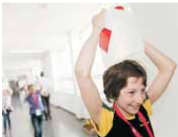
Wasser tragen ist eine Kunst!