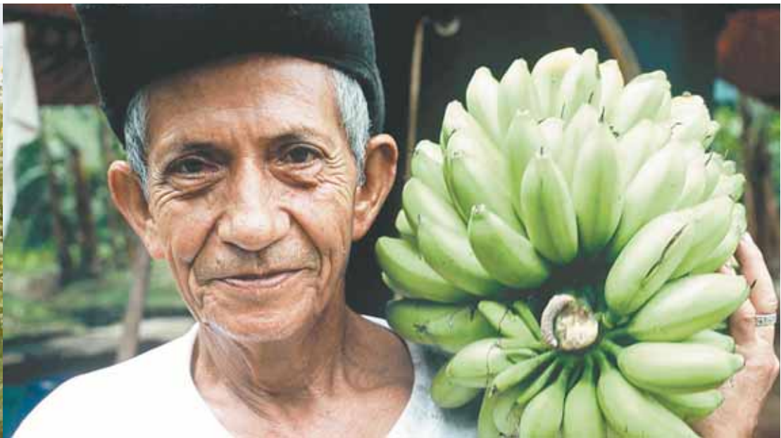
Blumen und Bananen zählen zu den „Hits“ bei fair gehandelten Produkten aus der „Dritten Welt“. FAIRTRADE AUSTRIA