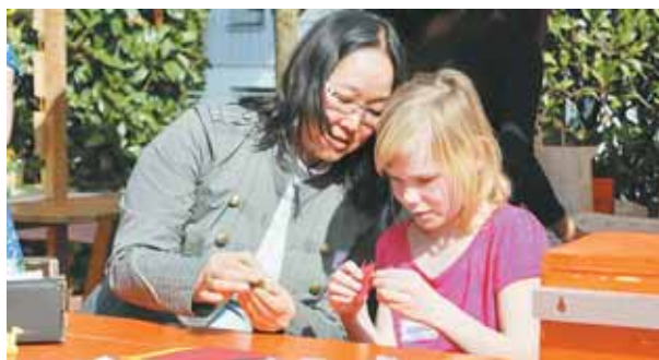
Menschen jeden Alters zeigten bei einer Aktion der youngCaritas.at, dass sie dem Leid in Japan nicht tatenlos zusehen.