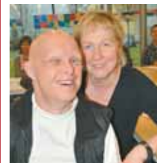
„Die Mischung macht´s ideal“, sangen Rapper zur Eröffnung.

„Ob mit oder ohne Handicap, das ist egal – die Mischung macht´s ideal“. Ein Rap der A-Capella-Gruppe „Da2Be“ machte klar, um was es dabei geht: Menschen mit und ohne Behinderung erhalten einen Treffpunkt, um ihre freie Zeit zu gestalten. Das Programm des „Füranand-Treffs“ ist äußerst abwechslungsreich: Koch-Treffs, ein Sonntags-Brunch, Stadtbum-