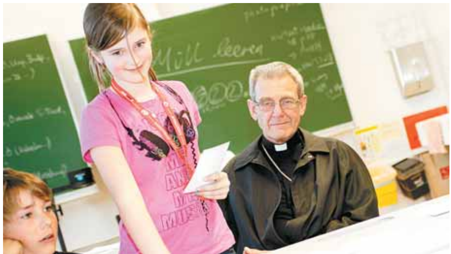
Spiele, Workshops und allerlei Wissenswertes um die Themen „Schöpfung“ und „Umwelt“ standen im Mittelpunkt des Festes. „Und jetzt weiß ich sogar, wie der Bischof ausschaut!“, stellte einer der Ministranten zum Ende hin zufrieden fest.