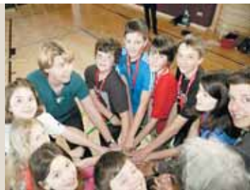
Am Anfang stand der Urknall!