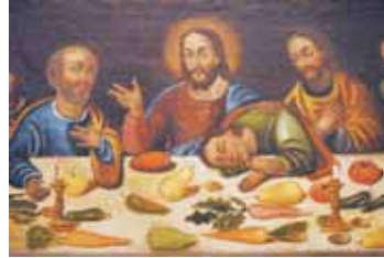
Die drei Tage vor Gründonnerstag.

Besonders am Herzen liegt den Schwestern die Feier der „Tage des Bräutigams“. Die frühe Kirche feierte von Montag bis Mittwoch der Karwoche die mystische Vermählung Christi mit seiner Kirche und mit jedem einzelnen. An diesen Tagen wartete die frühe Kirche auf das Kommen ihres Bräutigams. Schon der Montag steht unter dem Geschehen der Maria, die in der verschwenderischen Liebesgeste das Alabastergefäß zerbrach und Jesus salbte.