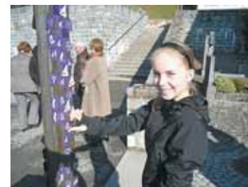
Die Haltestelle in Doren mit den beliebten Haltamol Plaketten.