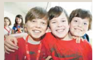
Auch die Buben fanden das Spielefest „echt cool“.