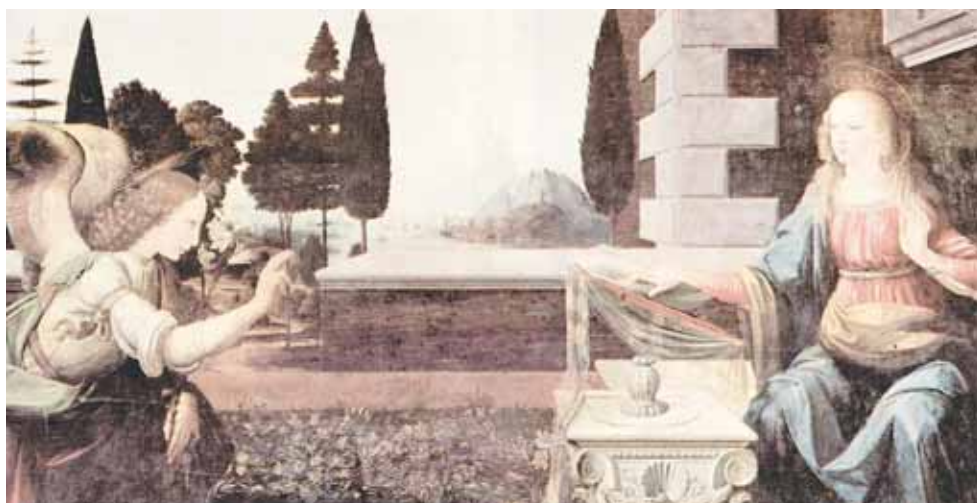
LEONARDO DA VINCI, VERKÜNDIGUNG, DETAIL (UM 1475)