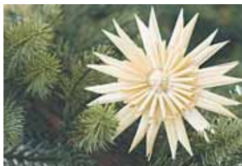
Ein Meisterwerk aus Stroh.

Erinnerung an die eigene Kindheit ist es für die einen, andere finden, dass sie aus Tradition zum Christbaum gehören: Strohsterne. Aus Sicht der Umwelt ist Christbaum- und Weihnachtschmuck aus Naturmaterialien auf jeden Fall erste Wahl. Zapferl, Haselnüsse und ein paar Reisigzweige kann man beim Waldspaziergang sammeln. Mit Kindern wird das zu einem Abenteuer, weil sicher auch der eine oder andere verwitterte Ast mitkommen muss. Mit Reisig und Zapferl, getrockneten Orangenscheiben oder Heubüscherln wird daraus eine hübsche Dekoration für das Wohnzimmer.