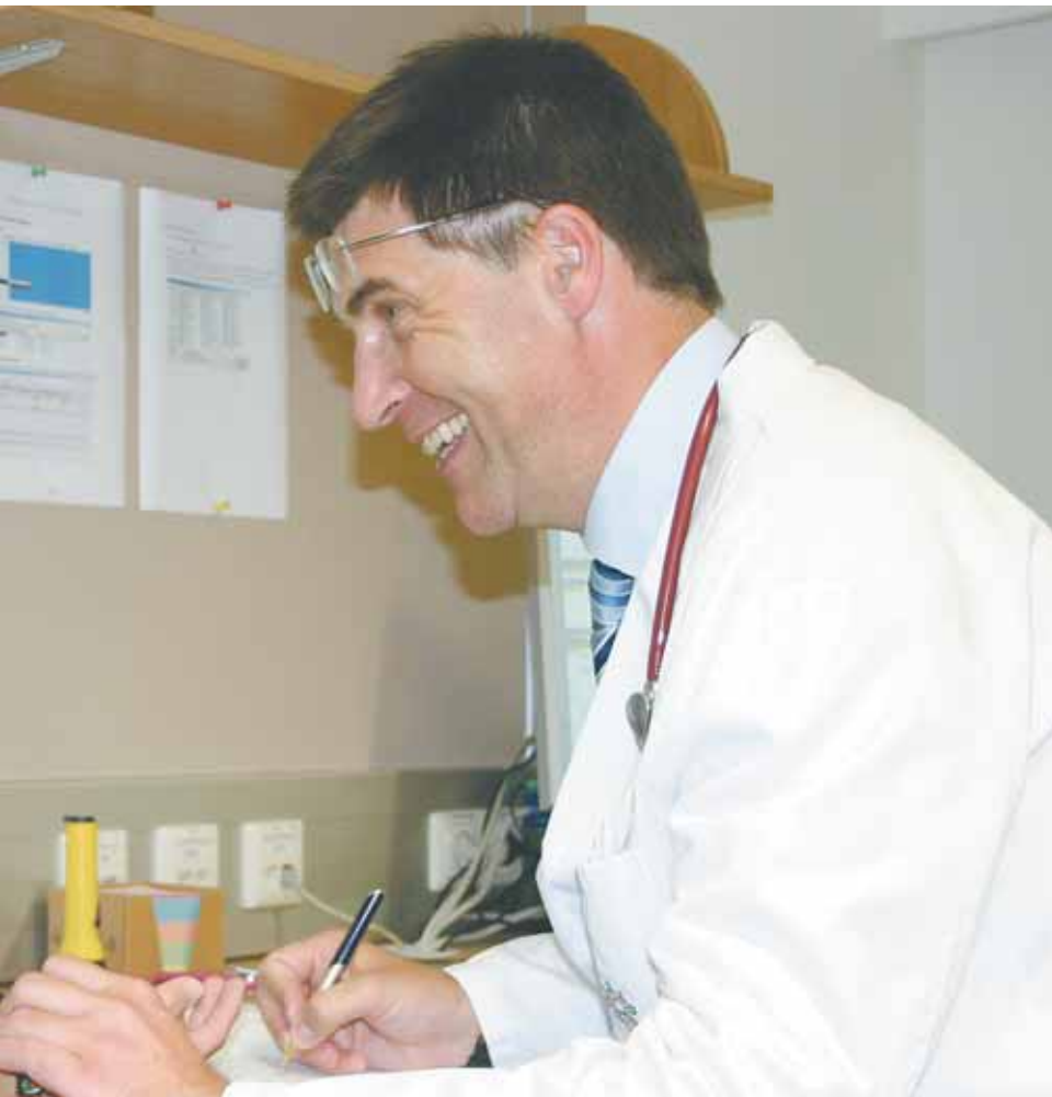
Sprechstunde beim Obdachlosenarzt im Vinzenzstüberl KIZ/EG (4)