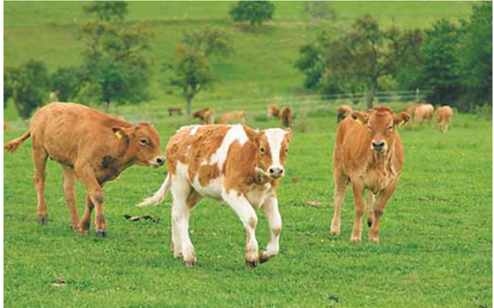
Wie die Kälber werdet ihr hinausgehen und Freudensprünge machen – oder doch nicht? wovo

Bewegt sein. Wir Heutige und zum Teil schon Ältere machen wohl keine Sprünge mehr wie die Kälber, aber unser Herz könnte bewegt sein und schwingen, könnte Flügel bekommen, wenn wir begreifen, dass Gott uns in Jesus das große Hoffnungslicht schenkt. Schon seine Geburt wird als Zeichen gedeutet. Und später verkündet