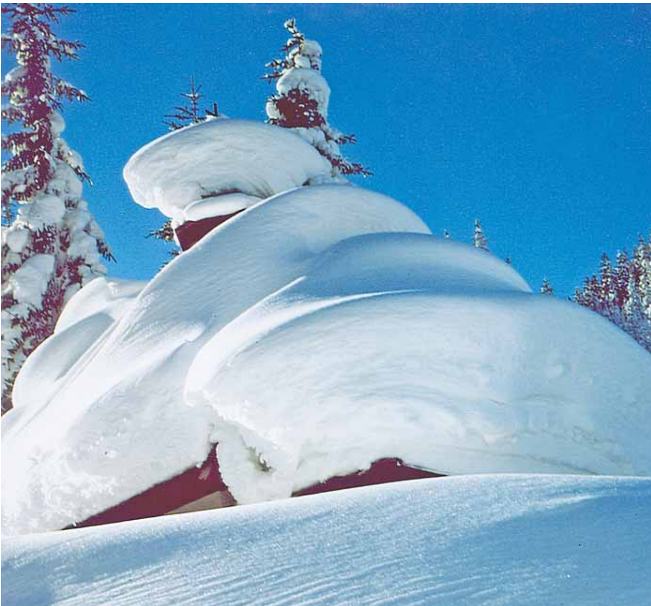
PFARRER FERDINAND PFEFFERKORN

2 Arme Menschen im Blick. Die Caritasgespräche 2010 nahmen die Menschen am Rand in den Blick.