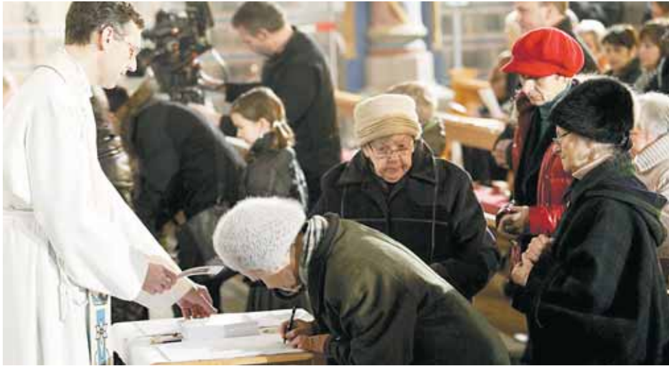
Großer Andrang: An die 800 Menschen kamen, um ihr Taufgelübde zu erneuern. D. MATHIS

Die „Lebensübergabe an Christus“ wurde zu einem eindrücklichen Fest