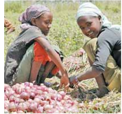
Ihre Spende ermöglicht gemeinsame Schritte gegen den Hunger