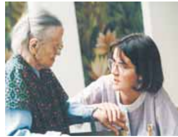
Lernen, Ehrenamtliche zu begleiten.

Ende September startet in Vorarlberg wieder eine Ausbildung zum Thema „Ehrenamtliche kompetent begleiten und motivieren“. Der Lehrgang „Strategisches Freiwilligen-Management“ wird von der Caritas organisiert. Erfolgreiche Freiwilligenarbeit will geplant, angeleitet und unterstützt werden. Freiwilligen-Manager/innen und -Koordinator/innen bewirken durch ihre hochwertige Begleitung, dass Ehrenamtliche der Organisation langfristig erhalten bleiben. Sie schaffen gute Rahmenbedingungen und sorgen für eine entsprechende Anerkennung des Ehrenamts.