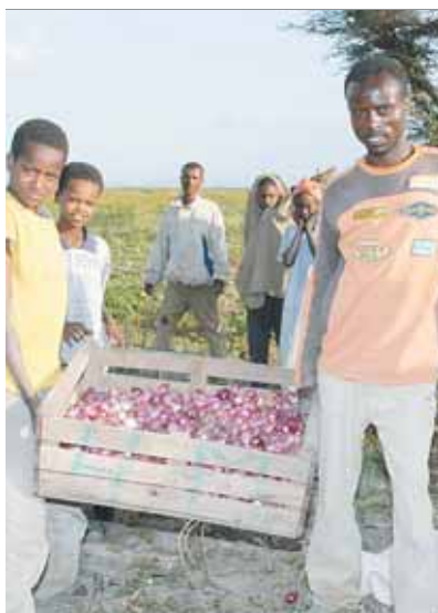
Durch Bewässerung und landwirtschaftliches Know-How konnte der Ertrag der Ernte gesteigert werden.

erfolgreichen Getreidebankenprojektes in Dugda und Bora, zwei anderen Regionen, in denen die Bauern mit denselben Schwierigkeiten konfrontiert waren. Um die Situation dieser Bauernfamilien zu verbessern, wurden 2005 in einer ersten Projektphase neun Genossenschaften gegründet, von denen jede eine Getreidebank mit modernen Lagerungsmöglichkeiten zur Verfügung hat. Auch die lokale Produktion für Mais und weiße Bohnen wurde verbessert. Die Bauern erhielten so die Möglichkeit ihre Ernte gemeinschaftlich in den neu errichteten Hallen zu lagern. Gleichzeitig gab es für die Mitglieder Fortbildungen im Marketingbereich. Die Bauern setzen ihr Wissen sehr effektiv um und erzielen so weitaus höhere Erträge für ihre Ernte. Das erhöht ihr Selbstbewusstsein, zudem sind die Menschen nun auch für kritische Situationen nach schlechteren Ernten wesentlich besser gerüstet.