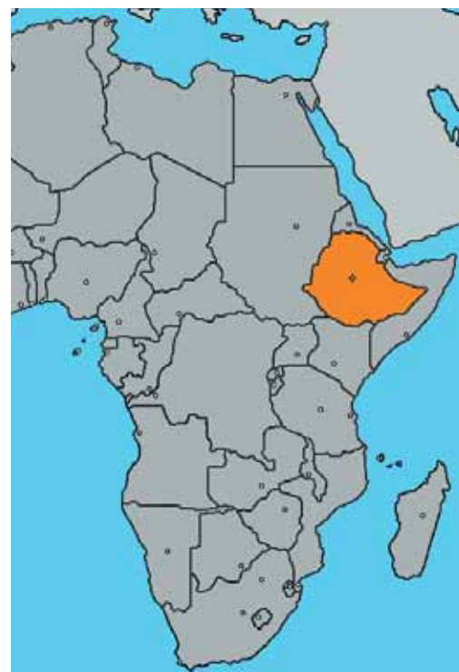
Äthiopien zählt zu einem der ärmsten Länder der Welt.

leben müssen. Es mangelt an Fachwissen sowie der gewinnbringenden Vermarktung der Produkte und an Startkapital. Dies hält den Großteil der Bauernfamilien in der Armutspirale gefangen. Die Caritashilfe setzt genau hier an: Gezielte Schulung, Beratung und Organisation der Bauern in Genossenschaften sowie die zur Verfügungstellung von Startkapital bzw. Mikrokrediten. Das wertvollste Gut in der Landwirtschaft ist jedoch der Boden. In unseren Landwirtschaftsprojekten versuchen wir gezielt, die ökologische Bewirtschaftung zu fördern und schrittweise Alternativen zum Einsatz von künstlichen Düngemitteln aufzuzeigen. Die Arbeit im Einklang mit der Natur verstehen wir auch als unseren konkreten Beitrag zu mehr Schöpfungsverantwortung. Martin Hagleitner-Huber, Leiter Auslandshilfe Caritas, Tel. 05522/200-1013