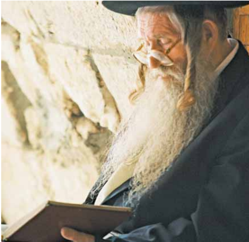
Das Studium der Thora ist für das Judentum zentral. Jesus stellt dieser Thora eine Botschaft gegenüber, die den Anspruch erhebt, die Erfüllung der Thora zu sein.

dem Gericht verfallen sein.“ Für Neusner Worte, die „in auffälligem Kontrast zu den Worten Mose am Berg Sinai stehen.“ Würde Neusner Jesus treffen, er würde ihm sagen: „Es hat den Anschein, als betrachtetest du dich selbst als Mose oder als über Mose stehend.“ Auch an anderer Stelle wird dieser Kontrast deutlich. Etwa wenn Jesus dazu einlädt, in seine Nachfolge statt in die Nachfolge der Thora zu treten.