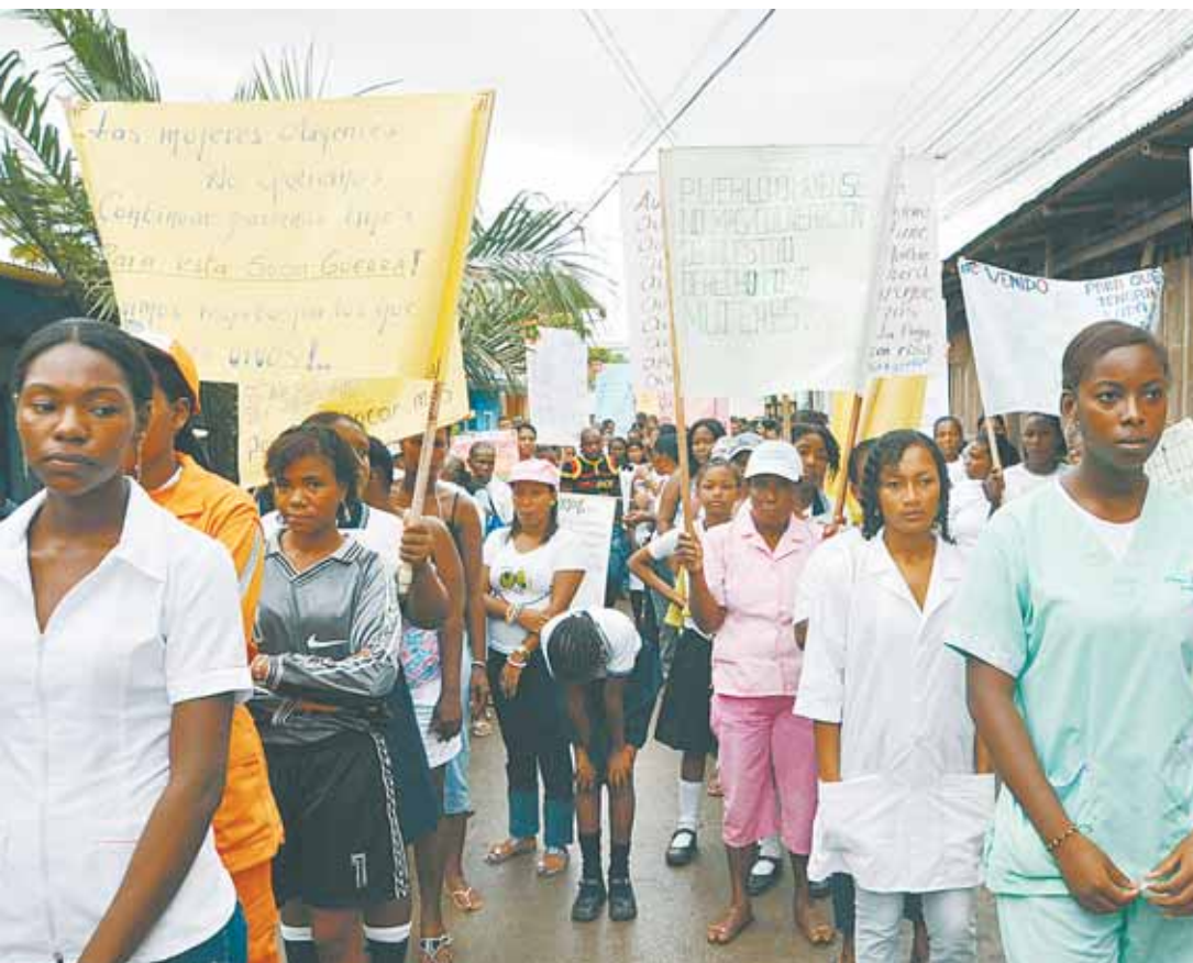
Beim Marsch der Frauen für das Leben gingen zahlreiche Kolumbianerinnen in Bocas de Satinga auf die Straße, um gegen die Gewalt in ihrem Land zu demonstrieren. SCHARER (4)

Das heißt, Megaprojekte werden geplant und durchgeführt; die geografisch günstige Lage wird für den internationalen Handel genutzt und es werden vermehrt Infrastruktur- und Straßenprojekte durchgeführt; der Boden wird mehr und mehr für Agroindustrien und Monokulturen wie zum Beispiel die Ölpalme benutzt; in großem Umfang werden Fischerei und Holzzabbau betrieben und die Ausbeutung der Bodenschätze vorangetrieben. Dazu werden die Gesetze zum Schutz der Afro- und Indigenabevölkerung, die dort lebt, zu deren Nachteil verändert. Darüber hinaus ist die Pazifikregion von einer starken Präsenz aller bewaffneten Gruppen betroffen. Ein weiteres Problem ist, dass durch die vermehrte Ausbreitung des Drogenhandels auch die Anbauflächen von Kokapflanzen stetig zunehmen. Dazu kommt, dass die Strategie der Ausrottung der Kokapflanzen durch Besprühen mit Herbiziden aus der Luft auch die Anbauflächen der dort ansässigen Bevölkerung, die ihre landwirtschaftlichen Güter vor allem für den Eigenbedarf produzieren, zerstören. Durch den Einsatz von Pestiziden kommt es zusätzlich zu gesundheitlichen Risiken und Schäden der Landbevölkerung.