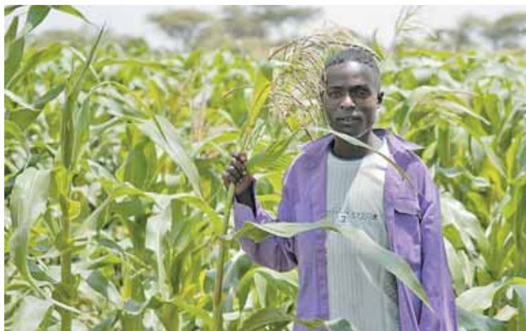
Dank Vorarlberger Know-How wachsen Gemüse, Getreide und verschiedene Pflanzen in zuvor unfruchtbarer Erde.

Pilotprojekt wird nun auch auf Adami Tulu ausgeweitet. Mit dem Vorarlberger Know-How zur Kompostierung werden gemeinsam mit Familien Gärten angelegt. Jede Familie benötigt hierfür ein Starterpaket für Kompostierung, das ein Flies, eine Mistgabel und eine Gieskanne beinhaltet. Das Starterpaket für eine Familie kostet 20 Euro. Die Caritas vor Ort informiert die Menschen über Ernährung und Gartenbau.