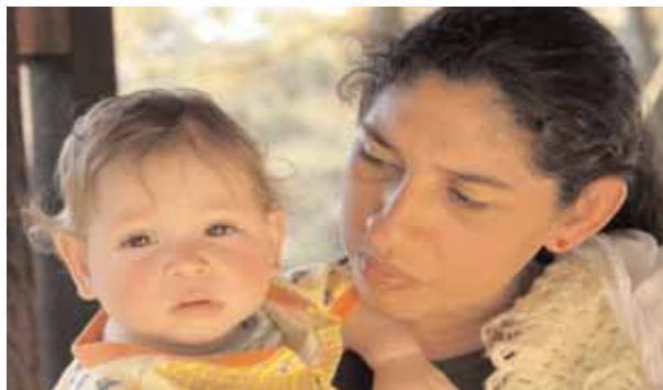
Marlene und ihr Victor , die - HIV positiv - auf dem „Land der Verheißung“ des „Stern der Hoffnung“ in Sao Paulo ein neues Leben finden (Name geändert). EICHER