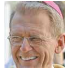
Die Schiffsprozession mit der Weihe Europas an das Unbefleckte Herz Marias ist Angebot an jede(n) von uns. KIBL

Bischof Dr. Elmar Fischer ist es ein echtes Herzensanliegen, alle Gläubigen der Diözese und darüber hinaus zur 29. Fatima-Schiffsprozession an Maria Himmelfahrt auf dem Bodensee einzuladen. Neben der stetig steigenden Teilnehmerzahl sieht der Bischof „eine starke Symbolik im Treffen der Schiffe aus drei Ländern im See. (...) Was in diesem Geschehen zentral wichtig ist: dieses Vernetzen zwischen den Ländern soll nicht nur wirtschaftlich zur Erhöhung des Lebensstandards geschehen. Es geht darum, Europa eine christliche Seele zu geben.“