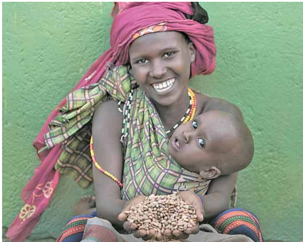
Für viele Menschen ist Saatgut ein kleines Wunder, das ihnen und ihren Familien das Leben sichert.