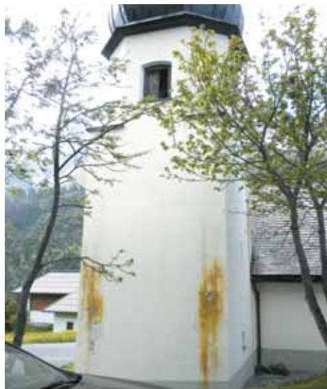
Das Zuger Kirchle muß trockengelegt werden, weil die Feuchtigkeit die Mauern hochzieht.

In der zweiten Etappe (2011) wird der Turm neu verputzt und gemalt, die Schutzdächer an den Ecken erneuert und – eventuell – die Turmkugel entrostet. Eine erfreuliche und „runde Sache“ wäre es, wenn man ins Zuger Kirchlein eine Bodenheizung einbauen könnte. Der Vorteil ist die konstante Niedrigtemperatur, die nicht nur ein angenehmes Raumklima, sondern auch die beste Maßnahme gegen die Feuchtigkeit wäre.