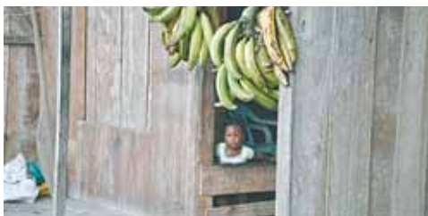
Menschenrechte auf Land, Ernährung, Gesundheit und Bildung werden in Kolumbien oft verletzt.

Das heißt, Megaprojekte werden geplant und durchgeführt; die geografisch günstige Lage wird für den internationalen Handel genutzt und es werden vermehrt Infrastruktur- und Straßenprojekte durchgeführt; der Boden wird mehr und mehr für Agroindustrien und Monokulturen wie zum Beispiel die Ölpalme benutzt; in großem Umfang werden Fischerei und Holzzabbau betrieben und die Ausbeutung der Bodenschätze vorangetrieben. Dazu werden die Gesetze zum Schutz der Afro- und Indigenabevölkerung, die dort lebt, zu deren Nachteil verändert. Darüber hinaus ist die Pazifikregion von einer starken Präsenz aller bewaffneten Gruppen betroffen. Ein weiteres Problem ist, dass durch die vermehrte Ausbreitung des Drogenhandels auch die Anbauflächen von Kokapflanzen stetig zunehmen. Dazu kommt, dass die Strategie der Ausrottung der Kokapflanzen durch Besprühen mit Herbiziden aus der Luft auch die Anbauflächen der dort ansässigen Bevölkerung, die ihre landwirtschaftlichen Güter vor allem für den Eigenbedarf produzieren, zerstören. Durch den Einsatz von Pestiziden kommt es zusätzlich zu gesundheitlichen Risiken und Schäden der Landbevölkerung.