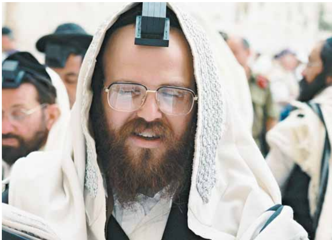
Ein Gläubiger Jude beim Gebet und beim Studium der heiligen Schrift der Juden, der Thora. Jacob Neusner will nicht mit Jesus mitziehen, weil „die Thora und die Lehren Jesu nicht zusammenpassen.“

Dass dies der Fall ist, zeigt sich in der Rede Jesu (Mt 5,21ff.), in der er sich mit deutlichem Anspruch messerscharf von der jüdischen Glaubenspraxis abhebt – etwa indem er meint: „Ihr habt gehört... dass gesagt worden ist: Du sollst nicht töten... Ich aber sage euch: Jeder, der seinem Bruder auch nur zürnt, soll