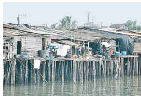
Alltag: So leben viele Menschen an der Pazifikküste Kolumbiens.

Bescheid wo man gerade unterwegs ist, wann man losreist und wann man in etwa erwartet werden kann, damit Alarm geschlagen wird, falls man nicht am Reiseziel ankommt.