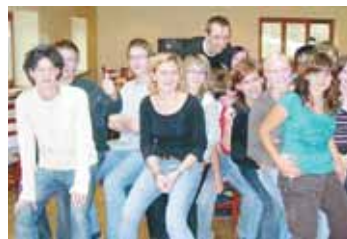
Unter dem Motto „Ein Tag für uns“ genossen viele Schulklassen die Orientierungstage der katholischen Jugend und Jungschar.

rungstage sind „mein Lebensweg - meine Zukunft, was mir wichtig ist im Leben, Freundschaft und Liebe, Sinn des Lebens.“ Ziele und Anliegen dieser Tage sind: Gemeinschaft erleben, Persönlichkeit entfalten, mit Konflikten umgehen lernen, Lösungen finden, Herausforderungen meistern, Verantwortung übernehmen, dem Glauben nachspüren und Spaß haben. Die Kommentare von Schüler/innen sind sehr positiv: „Es hat mir sehr gut gefallen, ich möchte gerne wieder kommen!“ „Die Referent/innen waren voll nett und voll cool drauf!“ „Es hat Spaß gemacht!“ „Danke für den schönen, lustigen Tag!“