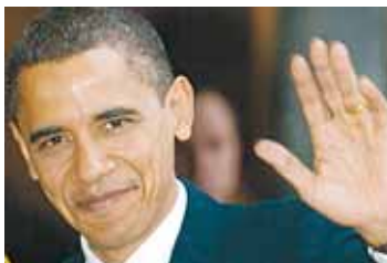
US-Präsident Barack Obama.

■ 20. Jänner: Der am 4. November 2008 gewählte US-Präsident Barack Obama wird vereidigt.