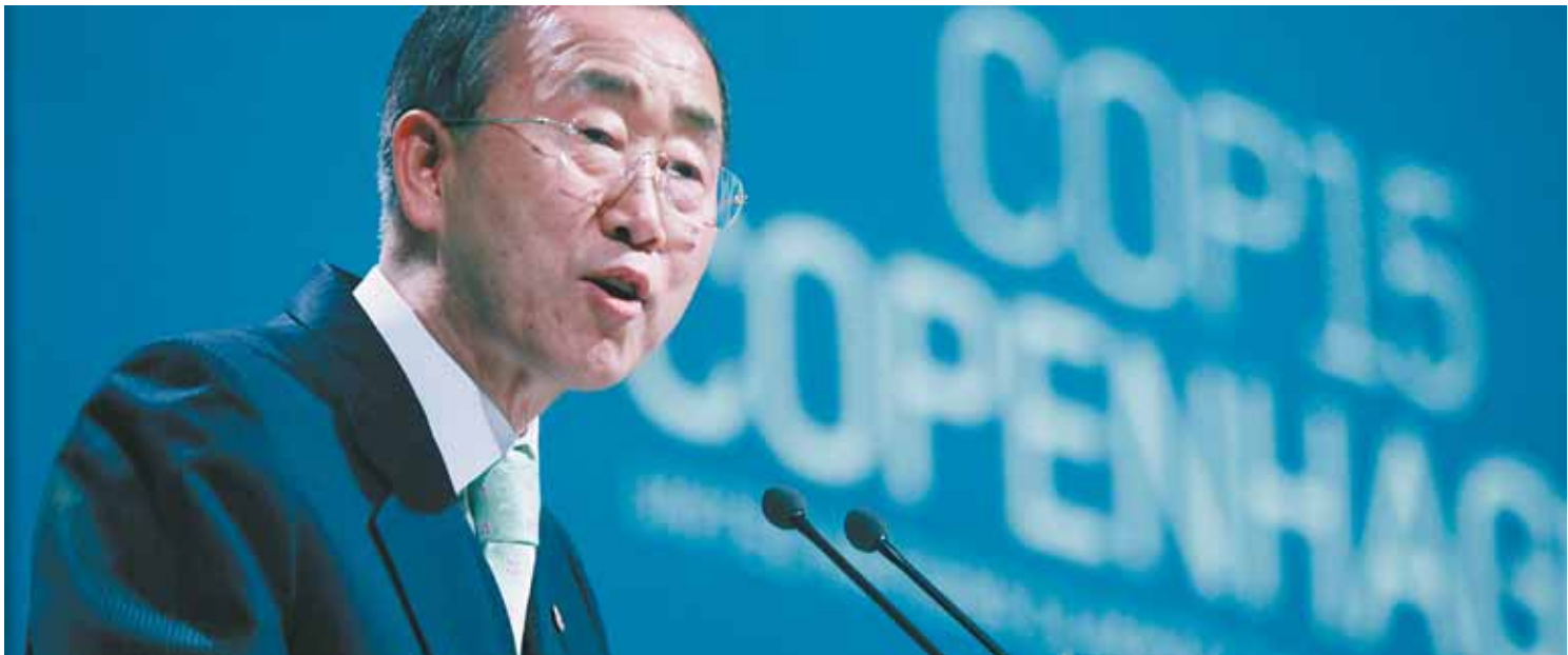
Bis zuletzt kämpfte UN-Generalsekretär Ban Ki-Moon gemeinsam mit den dänischen Gastgebern gegen ein Scheitern der Weltklimakonferenz.