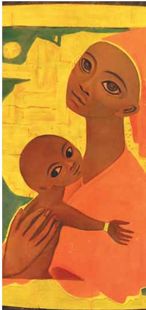
Jungfrau mit dem Kind , Glasfenster von Frère Eric, Taizé.

Die Gemeinschaft von Taizé hat diese Texte der Kirchenzeitung zur Verfügung gestellt. KIZ/A.