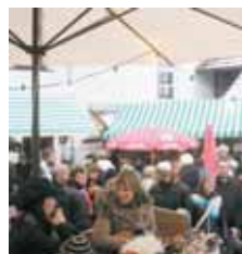
Tolle Atmosphäre beim Adventmärkte der Bludenz Franziskaner. SEEBURGER

Der Klosterhof der Bludenz Franziskaner bot mit seinen Marktständen wieder das besondere Ambiente für das Adventmärkte. Da gab es Irish Coffee beim Pfarrfestteam, bei der Bastelrunde vom Turmstüble wurden feine Marmeladen, Liköre und Kekse, aber auch Gestecke angeboten. Wunderschöne Torten und Kuchen servierte Michel's Familie und Freunde, bei Kolping konnte man Bienenwachskerzen und Marmeladen kaufen, der Pfarrgemeinderat lud zum Rieblesen ein, beim Garten- und Obstbauverein Bludenz/Bürs wurden Glühmost und Dörrobst angeboten und das Laurentiusteam schenkte Glühwein aus. RED