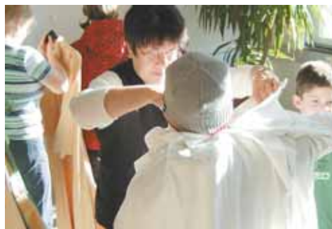
Anproben der Sternsingergewänder: In Gisingen werden die Kinder liebevoll von den Frauen des Teams eingekleidet. FRITSCH