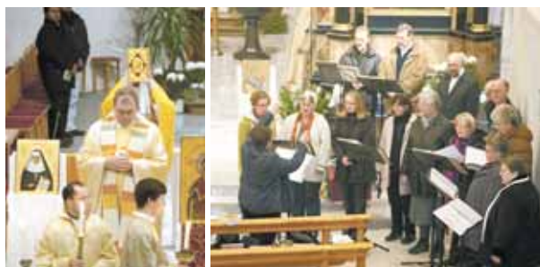
Der Johannes-Chrysostomos-Chor feiert in Nenzing die byzantinische göttliche Liturgie.