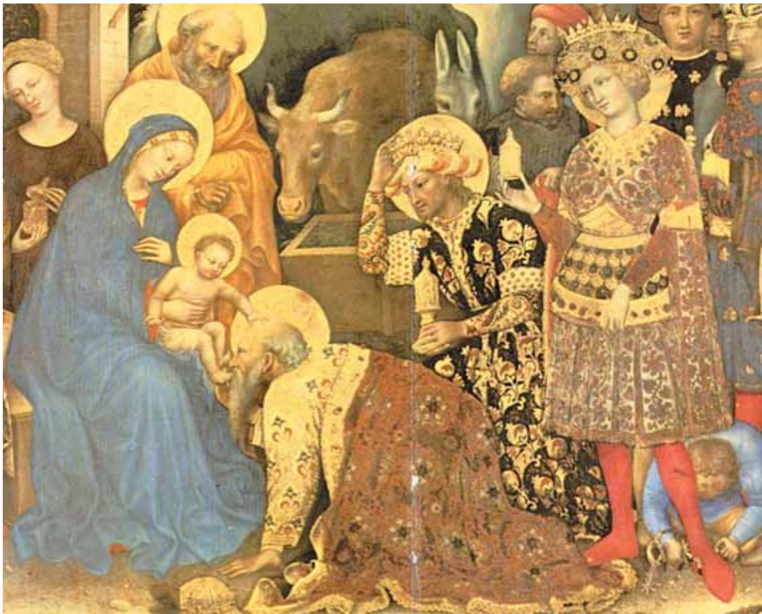
In der Anbetung von Gentile da Fabriano aus dem Jahr 1423 wird nicht ohne Ironie die „Renaissance“, die Wiedergeburt in jeder Lebensphase - im Gold der Jugend, im Weihrauch der Lebensmitte und in der Myrrhe des Alters - durch die Begegnung mit dem göttlichen Kind offenbar.

Weihrauch in den Straßenzügen Roms verduften. Er hatte wohl gehofft, dass ihn durch solchen Wohlgeruch auch seine Untertanen gut riechen könnten oder dass zumindest der Mief seiner Misswirtschaft weniger wahrnehmbar würde. Hat der zweite Magier mit seinem Weihrauch vor dem göttlichen Kind die Macht abgelegt? Hatte er es angesichts dieser Geburt nicht mehr nötig durch Schein und Werbung und durch den Duft der Macht etwas zu sein, was er gar nicht war? Hat er gar erkannt, dass im Lächeln des Kindes die wahre Macht der lauterer Anerkennung aufblitzt?