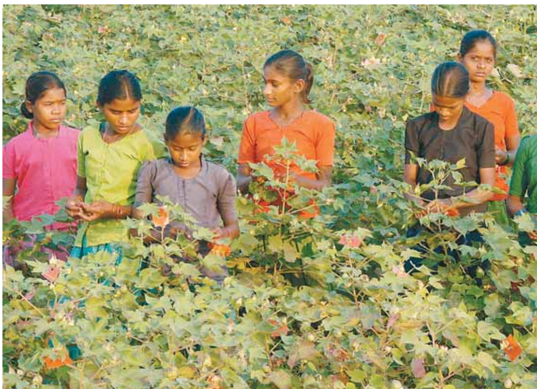
Kinderarbeit: Im indischen Maddur Mandal (Bundesstaat Andrah Pradesh) arbeiten rund 200.000 Kinder, vor allem Mädchen, auf Baumwoll-Plantagen. Mädchen werden in Indien stark benachteiligt, weil sie weniger wert sind als Buben und als Menschen zweiter Klasse angesehen werden. (DKA)