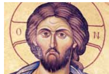
Christus - Thema der Alphakurse.

Vom 22.01. bis zum 26.03.2010 findet in Dornbirn-Oberdorf ein regionaler Alphakurs statt. Dieser Kurs ist ein Angebot für alle Menschen, die auf der Suche sind, die Fragen an das Leben haben, Fragen nach dem Sinn, nach Gott, nach dem Glauben. Eingeladen sind alle, die mehr über das Christentum erfahren möchten und nicht nur an Theorie interessiert sind, sondern ganz praktische Erfahrungen suchen. Vorwissen ist keines nötig. Beim Alphakurs dürfen alle Fragen gestellt werden.