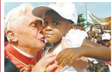
Papst Benedikt in Afrika.

■ 4.–25. Oktober: Die zweite Afrika-Bischofssynode zum Thema „Die Kirche in Afrika im Dienst von Versöhnung, Gerechtigkeit und Frieden“ findet im Vatikan statt.