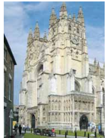
Andalusien, die Provence, das südliche England und Berlin, das sind die Destinationen im KirchenBlatt-Reise-Programm für 2010.