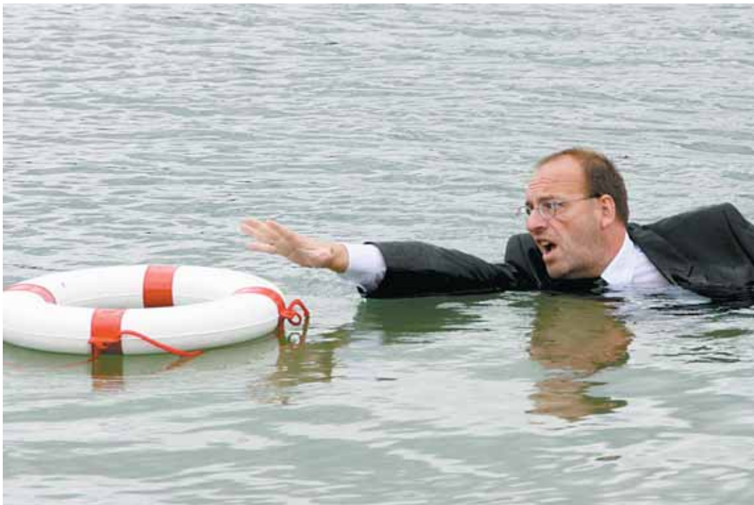
Rettung in der Krise. Wer in der Krise Hilfe bekommt und wer dafür zahlen muss, darüber wird seit Monaten heftig diskutiert. „Reichensteuer“ und „Transferkonto“ sind dabei zwei Pole, die aufeinanderprallen. FJR, WODICKA

einen wirklichen Hauptschulabschluss ist. Ich meine damit, dass die jungen Leute gut lesen, schreiben und rechnen können, denn das ist die Voraussetzung für den Einstieg in weitere Bildungs- bzw. Berufswege, die vor der Sackgasse Armut bewahren können.