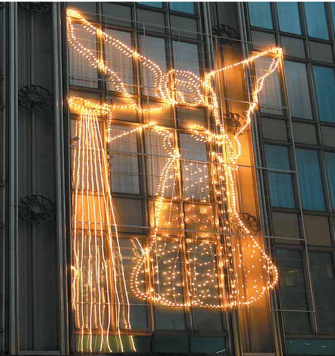
Der Engel der Heiligen Nacht erleuchtet die Herzen mit dem Licht der Liebe Gottes und verkündet die Liebe Gottes allen, die es hören mögen.

24. dezember 09 altes hallenbad feldkirch einlass: 22.00 uhr mette: 23.30 bis 0.30 uhr anschließend: tanzen! eintritt frei!