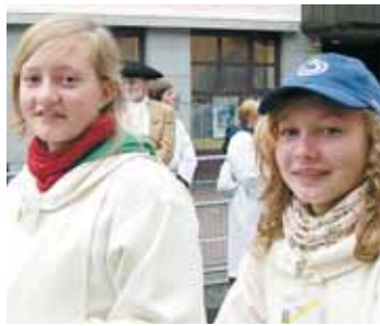
Ministrantinnen beim Papstbesuch