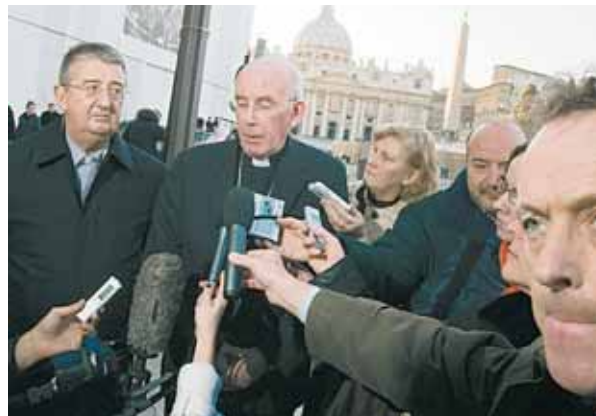
Kardinal Brady und Erzbischof Martin mussten sich nach der Aussprache mit dem Papst in Rom harten Fragen der Journalisten über die Zukunft der Kirche Irlands stellen.

Restlos aufklären. Die Spitzenvertreter der Kirche haben sich bei den Opfern, aber auch bei den Gläubigen für das „beschämende Verhalten“ entschuldigt. Papst Benedikt verurteilte den Missbrauch von Kindern durch Priester als „abscheuliche Verbrechen“. Er teile „die Empörung, das Gefühl des Verrates und der Scham, das so viele Gläubige in Irland empfinden.“ Der Papst pocht auf restlose Aufklärung – auch hinsichtlich der Verantwortung in der Amtsführung. Und er kündigte einen Brief an die Katholiken Irlands an. Die scharfe Reaktion des Papstes hat auch damit zu tun, dass erst im Mai dieses Jahres ein Untersuchungsbericht veröffentlicht wurde, der die systematische Misshandlung und den sexuellen Missbrauch von Tausenden Jugendlichen in Erziehungs- und Waisenheimen kirchlicher Orden zwischen 1914 und 2000 aufgedeckt hat. Eine Reihe von Orden hatte die Untersuchungen massiv behindert.