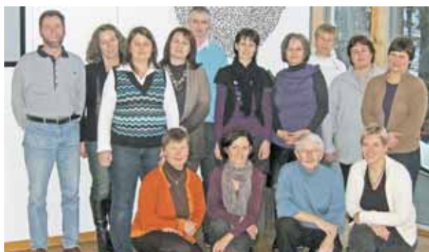
Die Abschlussgruppe des Glaubenskurses.

13 Teilnehmer/innen haben den Jahreskurs „Grundlagen christlichen Glaubens 2009“ abgeschlossen, der von Pastoralamt, KBW und dem Bildungshaus St. Arbogast angeboten wurde. In 14 Modulen wurden die Bibel, die Fundamente des Glaubens, Diakonie, Ethik, Liturgie und die Begegnung mit dem Islam nahegebracht. „Der Kurs war eine große Bereicherung für mich und ich fand einen Zugang zum Glauben, den ich vorher nicht hatte.“, meint eine Teilnehmerin.