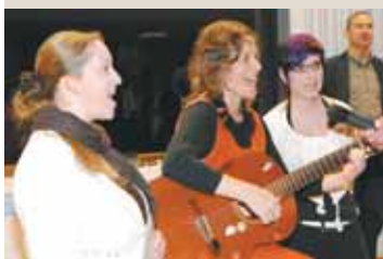
Lobpreis und Dank in Form von fetzigen Gitarrenklängen.

Wer glaubt ist nicht allein. Im Anschluss an die festliche Messe feierten die beiden neuen Diakone mit Eltern, Verwandten, Freunden, Mitbrüdern und Pfarrangehörigen. Das Pfarrzentrum Frastanz bot dafür den angemessenen Rahmen.