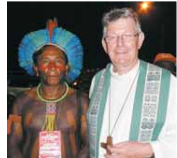
Bischof Erwin mit einem Kayapó-Indianer ORF

Ich hoffe, dass uns noch mehr bewusst wird, dass wir in einem sicheren, reichen und wohlgeordneten Land leben. Erwin Kräutler geht einen Lebensweg, der auf Grund der ständigen Morddrohungen äußerst gefährlich ist: Bischof Erwin sagt aber auch: „Es 'hagelt' sprichwörtlich Liebeserklärungen für mich, dafür, dass ich diesen Weg mit den