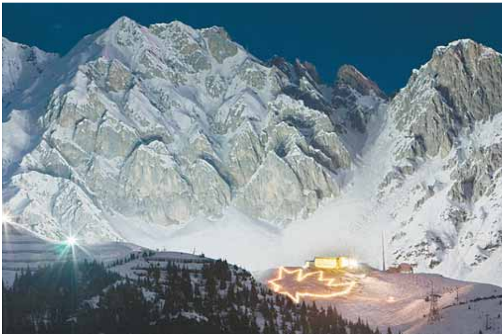
Sterne für das Christkind leuchten von der Innsbrucker Nordkette und in Einkaufsstraßen von Wien, Graz, Innsbruck und Salzburg sowie in einigen Orten in Niederösterreich.