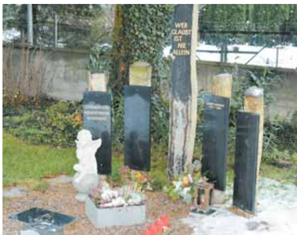
Die Urnenbegräbnisstätte des Ethik & Umwelt Krematoriums auf dem Stadtfriedhof Hohenems wird auch an Weihnachten gepflegt.

Die Frage des Gedenkens ist bei der Gemeinschaftsurnenstätte individuell gelöst: Auf Wunsch können Name, Geburts- und Sterbedatum festgehalten sein, ebenso ist eine anonyme Beisetzung möglich. Für eine Beisetzung in dieser Grabstätte des Krematoriums