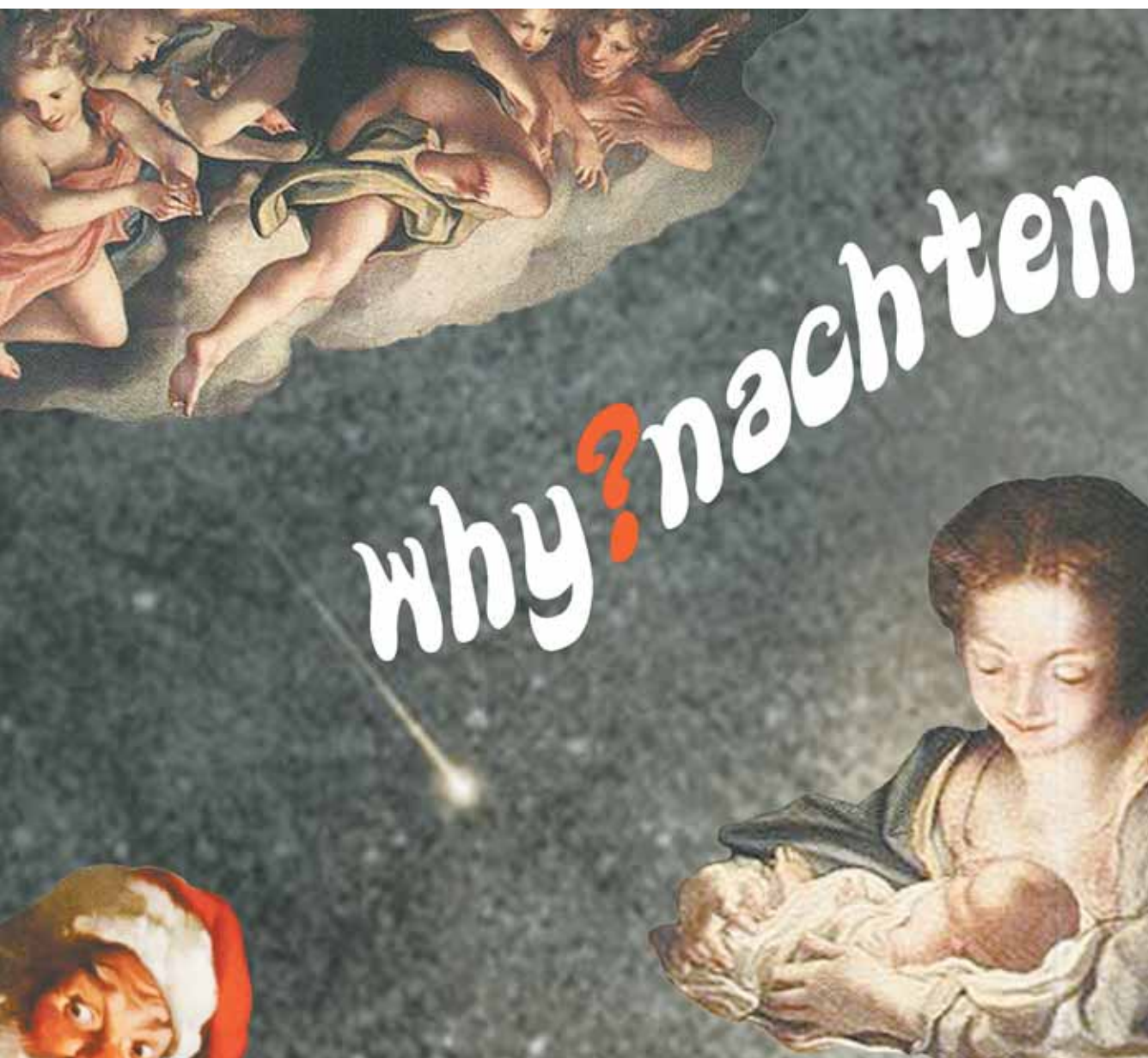
FOTOCOLLAGE VON JOHANNES LAMPERT

2 why?nachten. Die große Chance für jede/n: Gott hat ein Gesicht und jeder Stern birgt einen Namen.