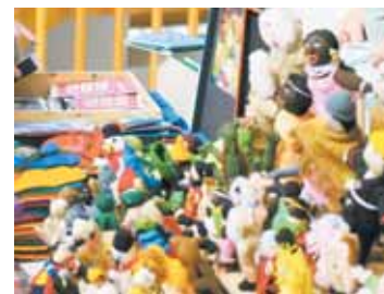
Werkstücke aus den Kreativkursen

Die Werkausstellung gibt Einblick in das abwechslungsreiche und interessante Kursangebot. Es werden Muster der Kurse präsentiert und handgefertigte Werkstücke zum Verkauf angeboten. Gleichzeitig kann man sich zu einem der Kurse anmelden.