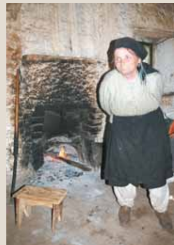
Bittere Armut herrscht in den Bergen Albaniens. PROJEKT ALBANIEN