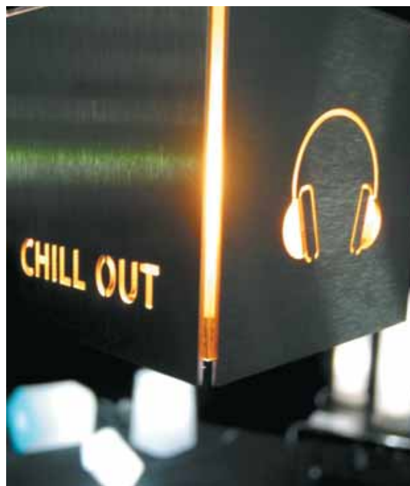
Alles Gute zum Geburtstag, Jesus! - Alle sind zur Geburtstagsparty eingeladen.

Die Antwort auf diese Frage ist leicht gegeben. Man muss sich nur die Situation junger Leute am Weihnachtsabend vor Augen führen. Viele von ihnen suchen am „Heiligen Abend“ nach der Bescherung und dem Familienessen das Weite, um irgendwo Gleichgesinnte zu treffen. Sie wollen wohl den Stress dieses Abends auf ihre Art mit Musik und Rhythmus abbauen. Und genau dahin gehen wir eben. Wir warten nicht, bis diese jungen Menschen zu uns kommen, wir besuchen sie dort, wo sie sind und feiern dort mit ihnen das Kommen Gottes in ihr und unser Leben, mit all seinen Sehnsüchten, Hoffnungen und Wünschen.