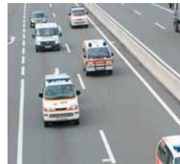
Das Krematorium in Hohenems ein Ort der Wandlung. ROTES KREUZ

Der Katastrophenzug aus Vorarlberg übte unter herausfordernd realen Bedingungen die Übungsannahmen eines Dammbruchs, von Suchaktionen, eines Höhlenunglücks, einer Krankenhausevakuierung, von Kommunikationsproblemen, eines Grubenunglücks sowie diverser Rettungs- und Versorgungsszenarien realitätsgetreu zu bewältigen. Mit Hilfe solcher Großübungen werden die Kompetenzen, die Schlagkraft und die Flexibilität