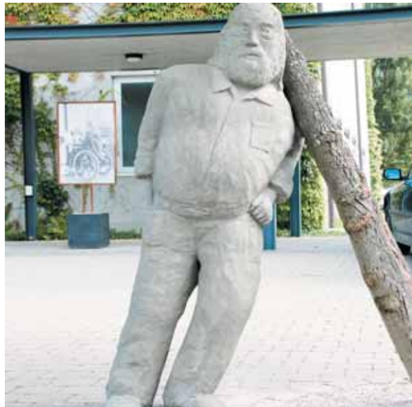
Stütze für einen schiefen Baum als künstlerische Intervention im Altacher Dorfzentrum vor der Kirche. Pfarre Altdorf

Elternverein für sehgeschädigte Kinder, die Lernhilfe für Kinder mit nichtdeutscher Muttersprache, der Rollstuhlclub, der Krankenpflegeverein, die Pfarrcaritas, die Lebenshilfe und das Sonderpädagogische Zentrum Götzis sowie das Schulheim Mäder.