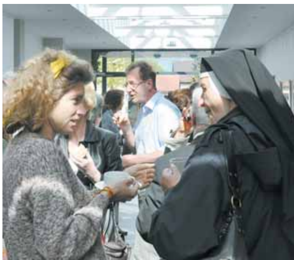
Pastoralgespräch. Die „Wege der Pfarrgemeinden“ leben vom Interesse der Menschen vor Ort. STEINMAIR

Denn neben der Vorbereitung notwendiger Entscheidungen will das Pastoralgespräch vor allem Orientierungen für die Gestaltung des pfarrlichen Lebens vor Ort liefern.