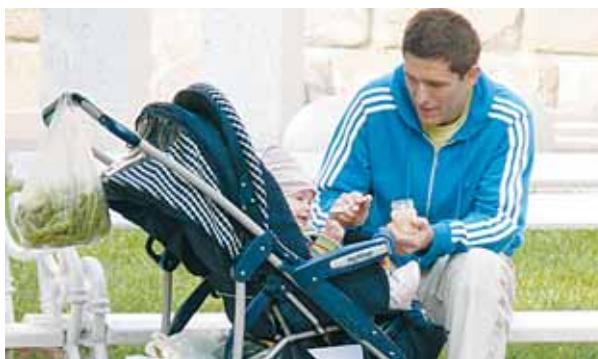
Die neue Kindergeld-Variante trägt laut KMBÖ zur Väterbeteiligung in der Kindererziehung bei.

„Regel-Irrgarten“. Der Katholische Familienverband Österreichs begrüßt die neue Variante des Kinderbetreuungsgeldes ebenfalls und lobt die Abschaffung der Rückzahlungspflicht beim Zuschuss, fordert jedoch den Rückbau des gesetzlichen „Regel-Irrgartens“ durch die Abschaffung der Zuverdienstgrenze.