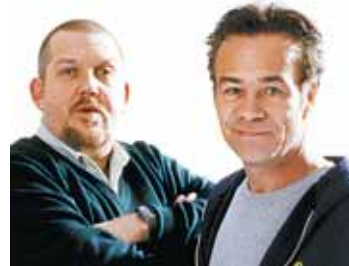
Dietmar Bär (li), und Klaus J. Behrendt - für eine gute Sache

Im Jahr 1998 wurde die Tatort-Folge "Manila" gedreht, in der es um philippinische Straßenkinder geht. Die TV-Kommissare wurden von den dort herrschenden, katastrophalen Umständen sehr geprägt. So sind beispielsweise 20.000 Kinder grundlos in heruntergekommenen Gefängnissen eingesperrt. Daher haben sich die "Kommissare" entschlossen, den Verein "Tatort - Straßen der Welt e.V." ins Leben zu rufen. In Fra-