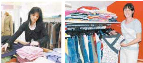
Die Second-Hand-Shops der Caritas in Dornbirn, Hohenems, Bludenz und Feldkirch bieten aktuelle Sommermode, Kinderbekleidung und Accessoires für jeden Geschmack zu äußerst günstigen Preisen in freundlicher Atmosphäre.

In den Second-Hand-Shops der Caritas in Dornbirn, Hohenems, Bludenz und Feldkirch sind nicht nur Damen-, Herren- und Kindermode zu günstigen Preisen erhältlich. Darüber hinaus wird mit dem Kauf eines Second-Hand-Artikels auch ein Arbeitsprojekt der Caritas Vorarlberg unterstützt, das seinerseits vom Land Vorarlberg und vom AMS gefördert wird. In den Caritas-Läden gibt es befristete Arbeitsplätze für langzeitarbeitslose Frauen, für die die Teilnahme an einem solchen Projekt nicht nur die Möglichkeit auf einen Arbeitsplatz bedeutet, sondern auch eine oft lebenswichtige Zukunftsperspektive. CARITAS/RED