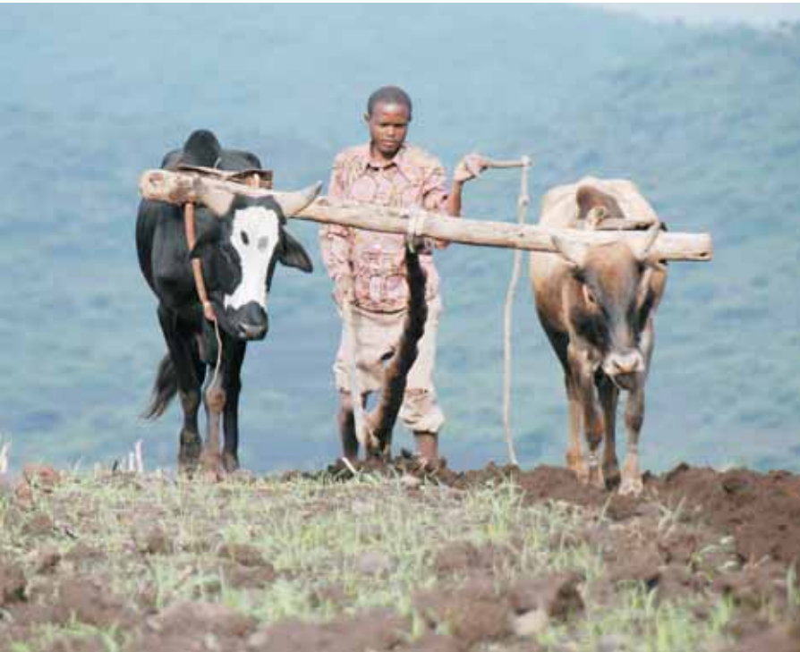
Die Landwirtschaft ist für viele Äthiopier das wichtigste Standbein um ihre Familie zu ernähren.

Wir sind im reichen Europa gut informiert über die Not in der Dritten Welt, haben tausende Bilder von abgemagerten Kindern und verelendeten Erwachsenen gesehen und unzählige Berichte vom Hunger in Afrika gehört. Wenn man es an Ort und Stelle erlebt, ist es ganz anders. Die Not wird in ihrer unmittelbaren Wirklichkeit fast unerträglich, es gibt kein Wegschauen oder Davonlaufen, man wird zum Teil des Elends, in dem man nicht helfen kann, man fühlt sich schuldig. Die Caritas Vorarlberg hat sich den nicht lösbar scheinenden Problemen, dem Hunger und den Krankheiten, dem Schicksal der Aidsweisen und Straßenkinder, der Unterdrückung der Frauen und dem Bildungsdurst der jungen Generation gestellt und bewirkt viel mehr als den berühmten Tropfen auf dem heißen Stein. Bei unserer Reise zu den diversen Projekten konnten wir uns überzeugen, wie dort nicht nur basale Hilfe, nicht nur Nahrung und medizinische Behandlung, sondern Hoffnung und Zukunft vermittelt werden. Mein Respekt für die Tätigkeit der Caritas hat sich in Äthiopien zur Hochachtung für die Einsatzleiter vor Ort gewandelt, für Menschen, die aus wahrer Menschlichkeit und christlichem Idealismus ihr Schicksal mit jenem der Notleidenden in Äthiopien verbinden. Man darf sich sicher sein, dass sein Spendengeld nirgends besser angelegt ist.