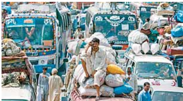
Flüchtlinge aus dem Swat-Tal im Nordosten Pakistans kehren in ihre Dörfer zurück.

Die pakistanische Regierung hatte vor kurzem mit der Rückführung der Flüchtlinge aus dem Swat-Tal im Nordwesten des Landes begonnen. Zuletzt waren mehr als zwei Millionen Menschen vor der Terrorherrschaft der Taliban auf der Flucht; die Taliban sind mittlerweile von der Armee wieder zurückgedrängt worden. Rotes Kreuz, Caritas und ICMC (International Catholic Migration Commission) unterstützen die Flüchtlinge in dem asiatischen Staat; Rückführungen aus den Camps in die Dörfer haben mittlerweile begonnen.