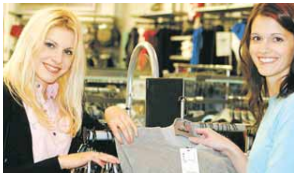
Carla Klamotte ab sofort in Feldkirch, Montfortgasse 9. Der Second-Hand-Shop ist montags bis freitags (9 - 12.30 und 14 - 18 Uhr), samstags von 9 bis 12.30 Uhr offen.