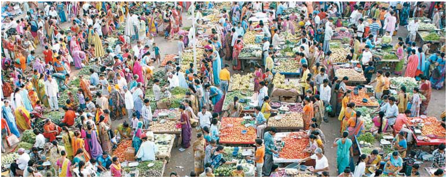
Indien wird China laut UN-Schätzungen bis zum Jahr 2050 als bevölkerungsreichstes Land ablösen. Dann werden 1,61 Milliarden Menschen in Indien und 1,42 Milliarden in China leben.