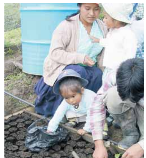
Das gemeinsame Anpflanzen in Familiengärten sichert das Überleben von Familien und bringt ein kleines Einkommen.