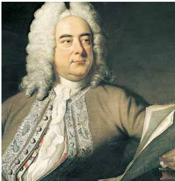
Georg Friedrich Händel verließ mit den Oratorien den elitären „Opernhimmel“ und schrieb Musik für das Volk. Am Ostermontag sendet ORF 2 ab 9.05 Uhr zwei Händel-Dokumentationen.

Das Erlösungswerk. Das Thema der christlichen Erlösung spannt sich als Bogen über die drei Teile des Oratoriums: Der erste Teil handelt von den Verheißungen des Alten Testaments und der Geburt Christi, womit die Gesetzmäßigkeit der Erlösung ihren Lauf nimmt. Im zweiten Teil werden das Leiden und Sterben Christi sowie die Errettung der Menschheit durch seine Auferstehung geschildert. Der dritte Teil ist das theologische