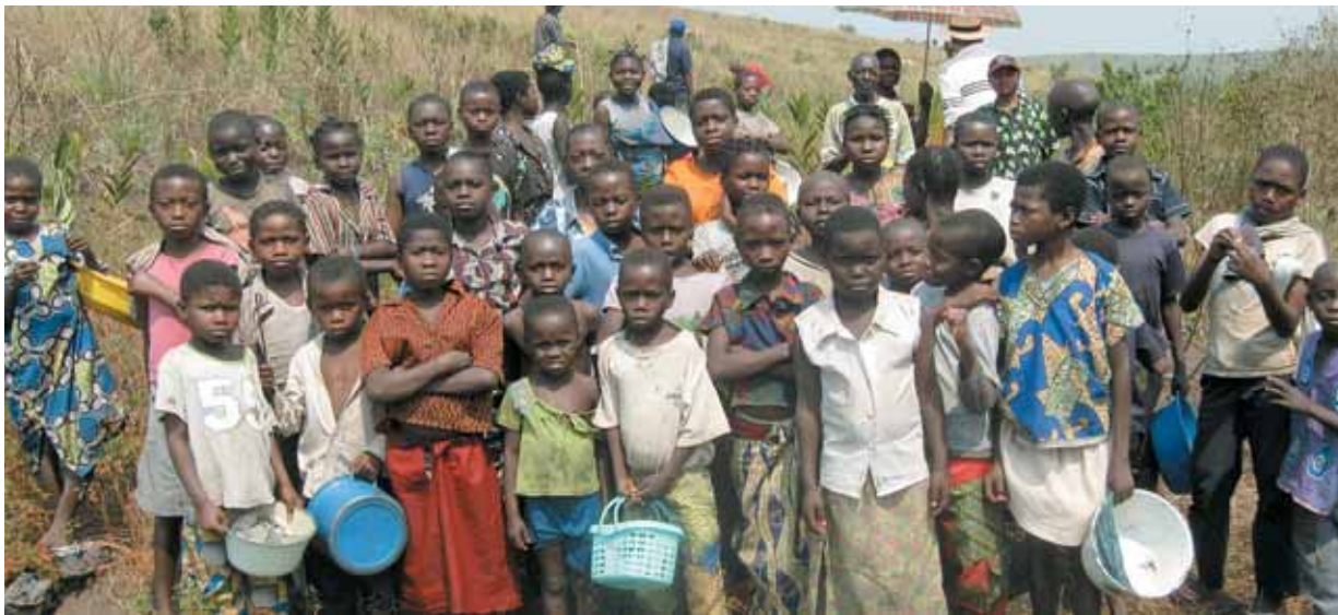
Das Projekt „Eine Schule für Feshi“ möchte eine Ausbildungsmöglichkeit für junge Menschen schaffen.

Batschuns und das Laternsertal für Feshi im Kongo