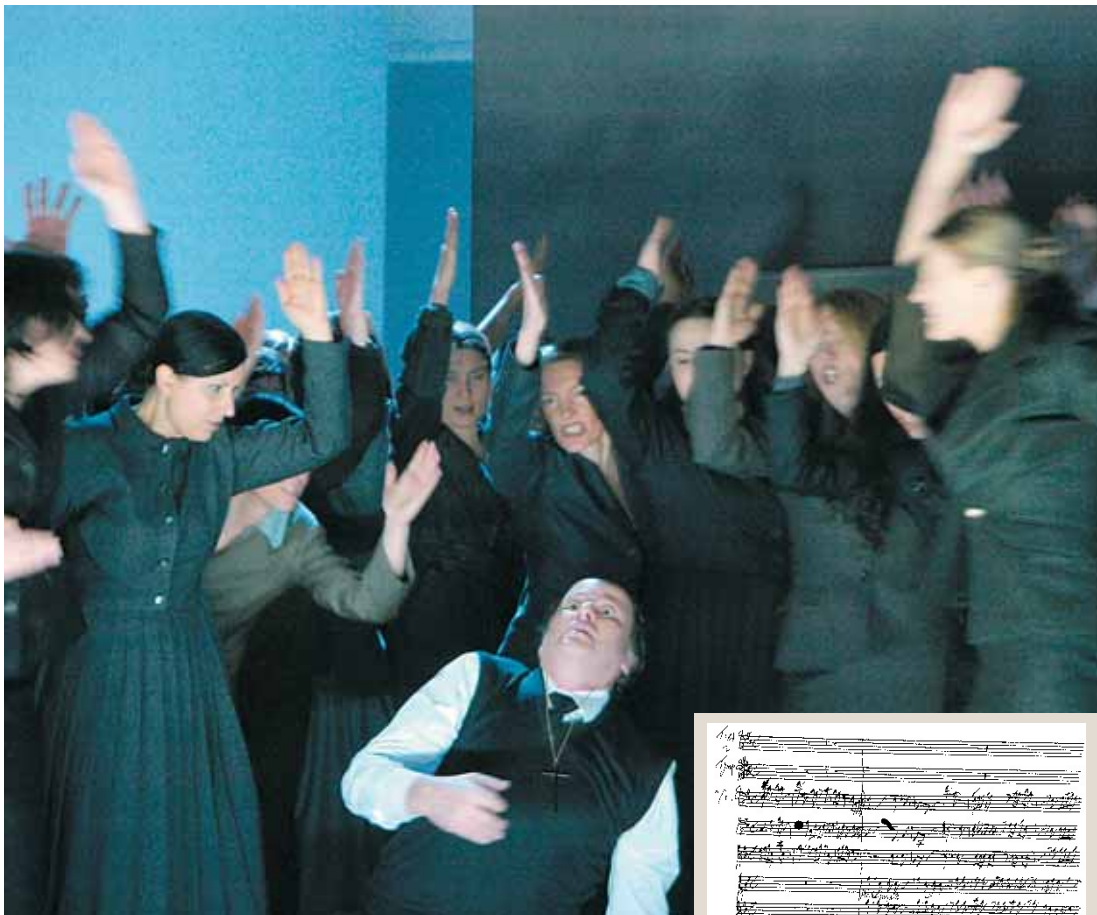
Mit dem Halleluja aus dem „Messias“ schuf G. F. Händel die Auferstehungshymne schlechthin (Originalhandschrift rechts). Der ORF überträgt den „Messias“ am Karfreitag in einer szenischen Darstellung aus dem Theater an der Wien (ORF 2, 22.50 Uhr).