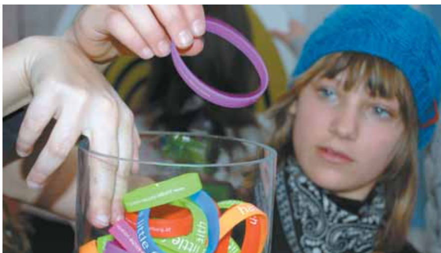
Reißenden Absatz fanden die Armbänder „have a little faith“ der Jungen Kirche in den knalligen Farben Neonpink, Neongrün, Rot, Blau und Violett. CHRISTIAN ORTNER

Von 3.-5. April besuchten viele Jugendliche den Messestand der Katholischen Jugend und Jungschar, JugendInitiativ und Jugendkulturen. Die besondere Attraktion in der jungen Halle war ein Schwungrad, an dem die jungen Leute kräftig und oft drehten.