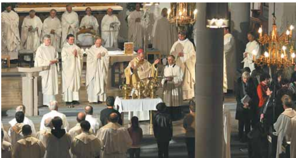
Die Weihe der Öle ist Höhepunkt der Chrisammesse zum Karwochenbeginn.