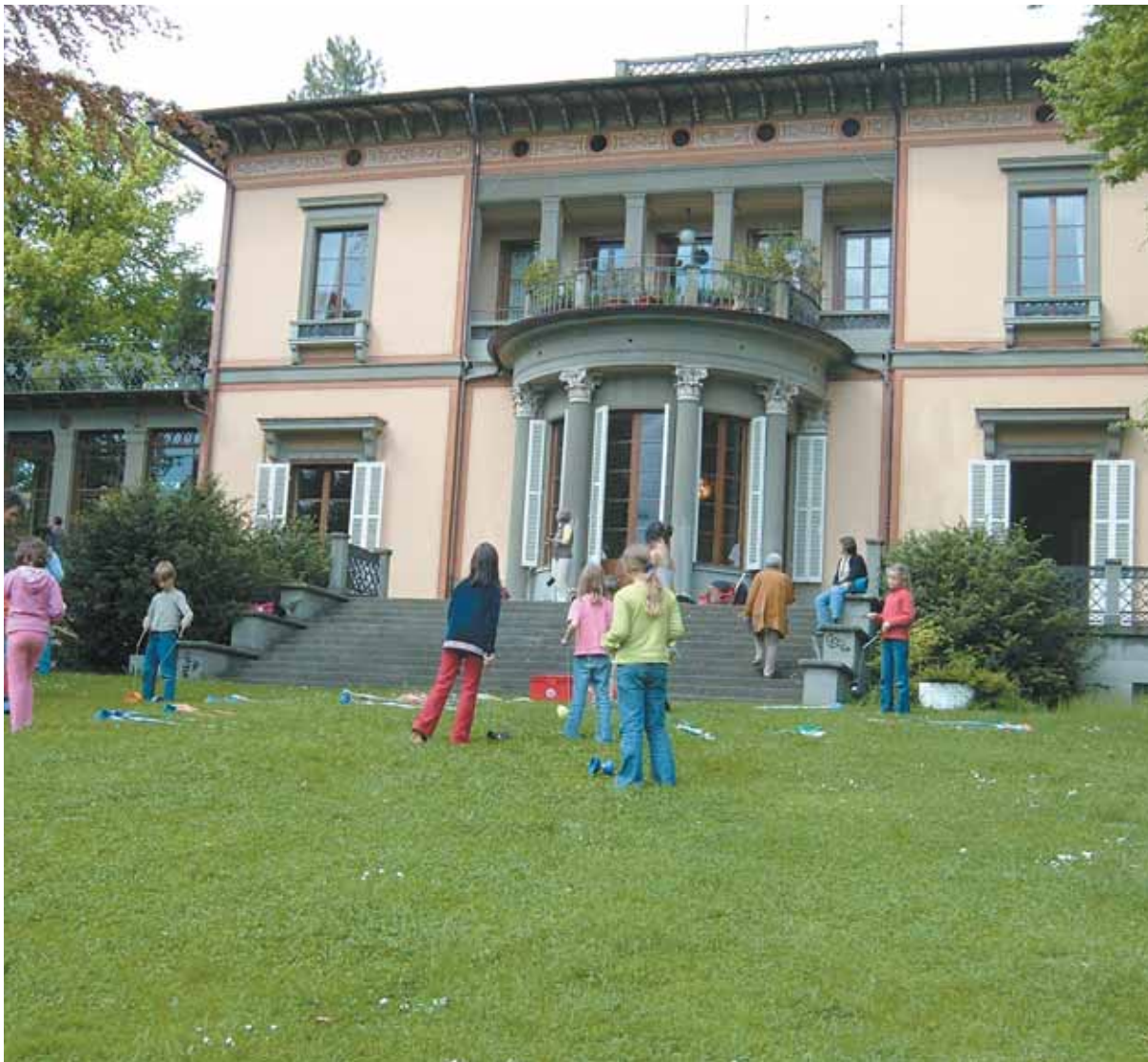
Heimat der „friedensräume“. Von der Villa Lindenhof erstreckt sich ein schöner Park zum Seeufer hin. Hervorragend geeignet für ein Spielefest.

Wasser kämpft. Vielleicht ist sie Wissenschaftlerin, die Missbrauch veröffentlicht, Friedensmahnwachen organisiert und deren Leben bedroht wird. Sie macht Gewalt für andere sichtbar. „Anonyma“ ist gleichbedeutend mit Mut, friedlicher Aktion und Zukunft. Wo oder wo sie auch sein mag, sie lebt in einer Welt, in der Friedensarbeit gefährlich ist.