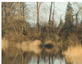
Alter Rhein: Fluchtpunkt/Grenze.

Zum Gedenken an die Grenzschließung, die Entlassung von Polizeikommandant Paul Grüninger vor 70 Jahren und in Solidarität mit Flüchtlingen heute wird am Ostermontag eine Wanderung angeboten, vom Zoll in Diepoldsau zu den Stationen Rohr am Alten Rhein, Ausschaffungsgefängnis in Widnau, Grab Paul Grüningers in Au und Schlussveranstaltung um 16 Uhr