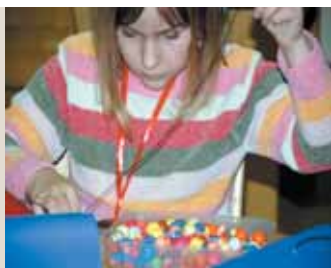
Geschicklichkeit war gefragt.