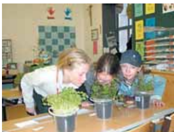
Viel Spaß hatten die Kinder.