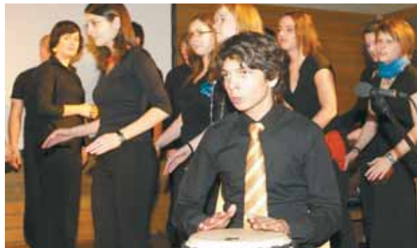
Auch der Landesjugendchor „Voices“ war bei der multikulturellen Gestaltung des Kongolesischen Abends dabei. PRIVAT (3)