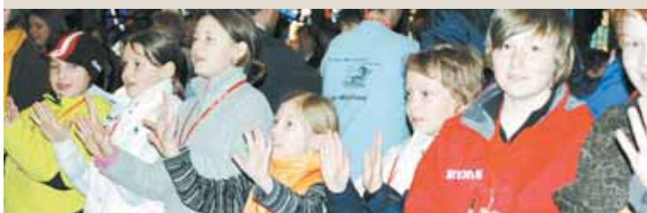
Mit einem gemeinsamen Gottesdienst starteten die Kinder in den Spielenachmittag.

Über 300 Kinder nahmen am Spielefest „Korinth - Paulus auf der Spur“ der Katholischen Jugend und Jungschar in der VS Dornbirn Schoren teil, und erfuhren in verschiedenen Workshops spannende Details über das Leben und Wirken des Apostels Paulus.