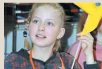
In den Bastelworkshops stellten die Kinder u.a. Öllampen aus Ton und Windrädchen aus Papier her.