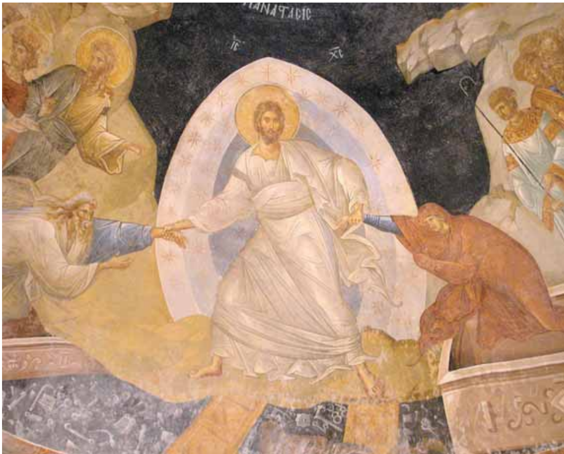
„I Anastasis“ - „Die Auferstehung“. Fresko in der Chora-Kirche (türk. Kariye Camii), im Istanbul Stadtteil Edirnekapý. Die Kirche wurde im frühen 16. Jahrhundert in eine Moschee umgewandelt, nach 1948 restauriert und ist jetzt ein Museum. Ihre Mosaiken und Fresken zählen zu den bedeutendsten Sakralzyklen weltweit.