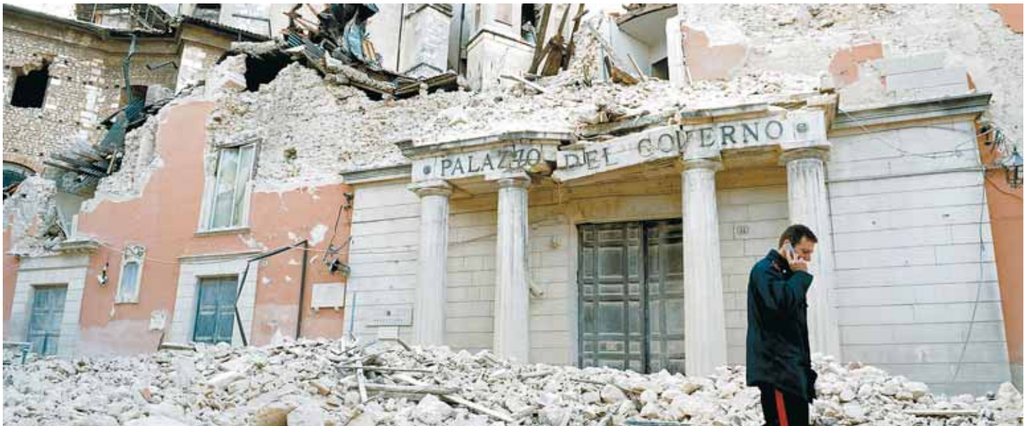
In der italienischen Stadt L'Aquila und der umliegenden Provinz sind nach einem Erdbeben mindestens 40 Tote zu beklagen.