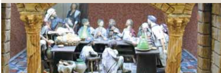
Das letzte Abendmahl mussten die Krippenbauer aus dem Inneren der Stadt an die geöffnete Stadtmauer verlegen, um es darstellen zu können.

Krippenbaumeisterer lassen bei ihrem Hobby normalerweise der Phantasie freien Lauf. Anders bei dieser Krippe: Die Gebäude wurden nach historischen Unterlagen möglichst detailgetreu nachgebaut, um einen Eindruck von Jerusalem zur Zeit Jesu zu vermitteln.