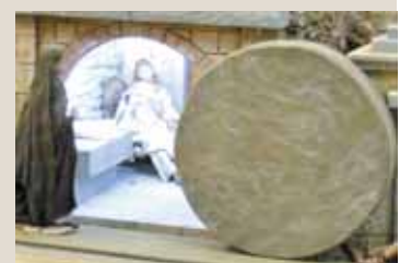
Mit Rollsteinen wurden Grabkammern zur Zeit Jesu verschlossen.