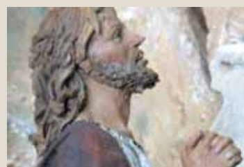
Die Figuren wie Jesus am Ölberg sind alle ungemein ausdrucksstark.