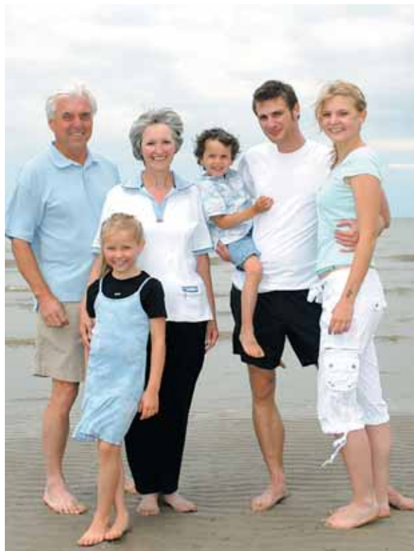
Kinder werden erwachsen und leben in ihrer eigenen Welt. Das soll gegenseitig respektiert werden.

Bei Fragen und Problemen wenden Sie sich an: ■ efz Feldkirch Herrngasse 4, 6800 Feldkirch Tel. 0043 (0)5522 74139 efz@kath-kirche-vorarlberg