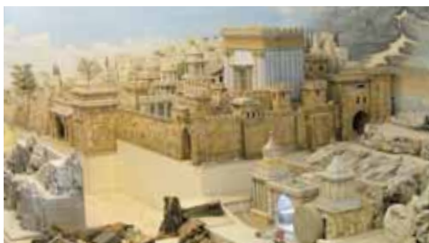
Jesursalem mit der Tempelanlage.

Der Leidensweg Jesu bis zum Tod am Kreuz auf Golgatha wird in der Krippe szenenhaft gleichzeitig dargestellt. Der Betrachter kann dabei die richtige Reihenfolge rekonstruieren.