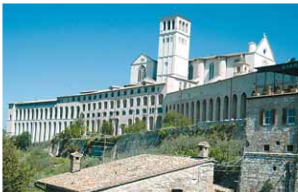
Im Jubiläumsjahr tagt von 24. Mai bis 20. Juni in Assisi das Generalkapitel des Franziskanerordens. KIZ/S. H.

134 Brüder. Derzeit zählen 134 Brüder zur „Franziskanerprovinz Austria vom heiligen Leopold in Österreich und Südtirol“. Die „Franziskanerprovinz Austria“ wurde im Oktober 2007 als Zusammenschluss der Tiroler mit der Wiener Ordensprovinz gegründet. Die Provinz umfasst 25 Klöster, das Provinzialatshaus befindet sich in Salzburg. In Bozen in Südtirol und in Hall in Tirol unterhält der Orden jeweils ein humanistisches Gymnasium und ein Schülerheim. Elf Brüder aus der Provinz Austria sind als Missionare in Bolivien und Südafrika im Einsatz.