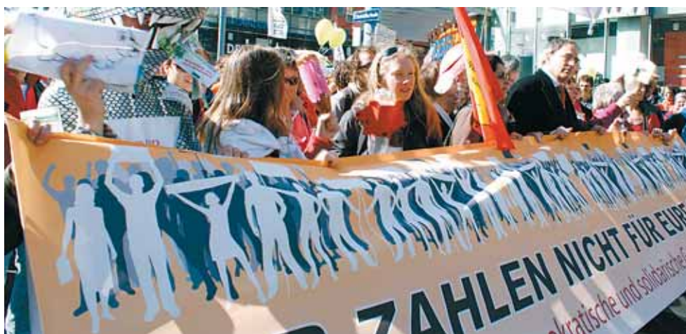
Unter dem Motto „Wir zahlen nicht für eure Krise“ demonstrierten am 28. März auch in Wien tausende Menschen gegen die Wirtschaftspolitik der führenden Industrieländer.