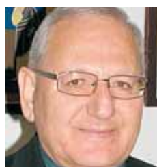
Erzbischof Louis Sako ist seit 2003 chaldäisch-katholischer Erzbischof der Diözese Kirkuk im Irak.

L. Sako: Sollten die US-Truppen, die seit dem Irak-Krieg im Jahr 2003 im Land sind, tatsächlich den Irak verlassen, könnte sich das problematisch auf die Sicherheit im Land auswirken, denn die irakische Armee und Polizei ist nicht stark genug, um den Menschen im Land die nötige Sicherheit zu bieten. Ich denke, bevor die Amerikaner abziehen, müssten sie dafür sorgen, das zerstörte Land wieder aufzubauen, Visionen für die Zukunft zu entwickeln, für Sicherheit im Land und an den Grenzen zu sorgen. Auch die internationale Gemeinschaft ist hier gefordert, bei einer Demokratisierung des Irak mitzuhelfen.