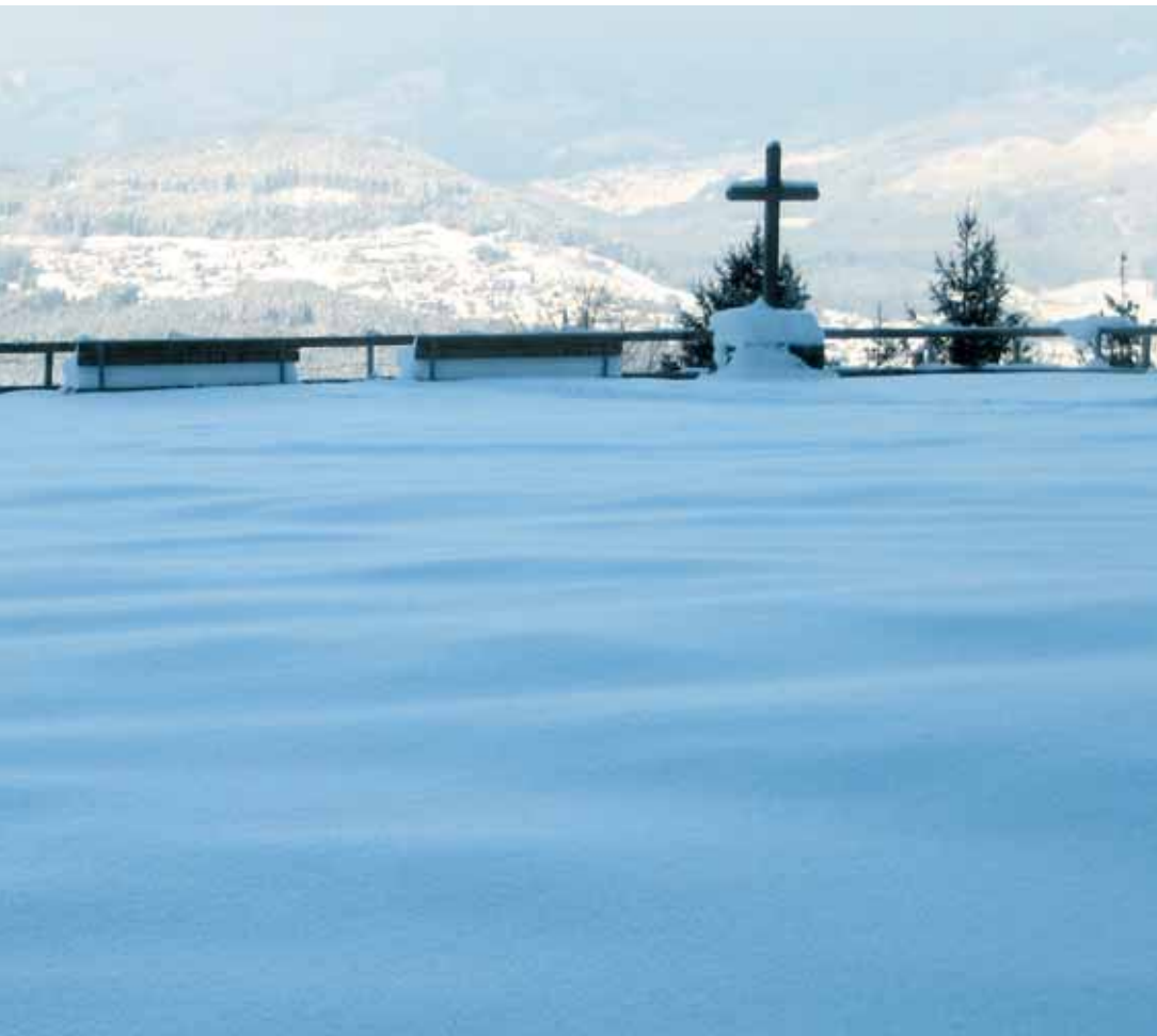
KREUZ BEIM AUSSICHTSPUNKT AMERLÜGEN / MEIER