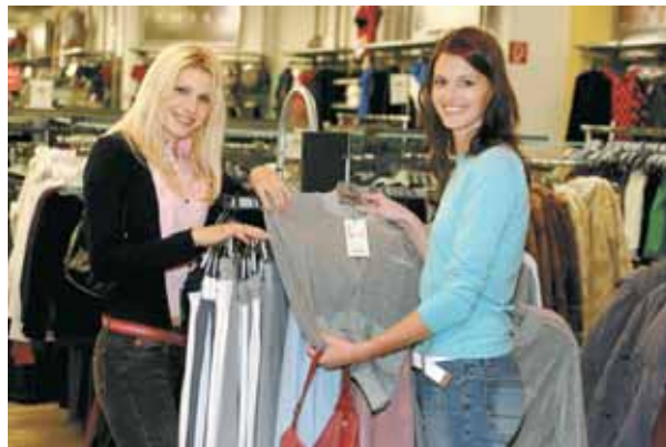
Frauen bekommen bei Carla eine neue Perspektive. CARITAS

Second-Hand-Shop bietet Aktuelles günstig. Von der aktuellen Sommermode in knalligen Farben bis zu Kinderbekleidung und Accessoires, im neuen Second-Hand-Shop „Carla Klamotte“ in Hohenems ist für jeden Geschmack und auch für jede Geldtasche etwas dabei. Seit kurzem hat der Second-Hand-Shop geöffnet. Sehr zur Zufriedenheit der vielen Kunden. „Das Sortiment ist toll“, sind sie sich einig. Nicht nur Damen-, Herren- und Kindermode kann jetzt auch in Hohenems in der Spinnerei 31 zu günstigen Preisen erstanden werden.