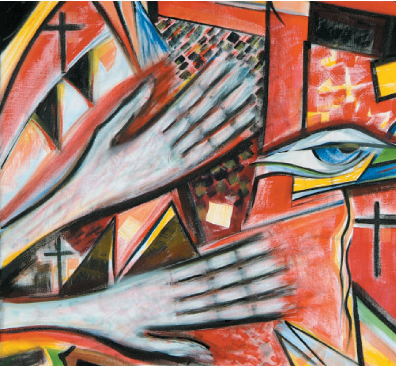
DETAIL AUS DEM FASTENTUCH DER PFARRE HASELSTAUDEN VON PROF. GERHARD WINKLER

2 Fastenzeit. Totgesagte leben auf. Die Pfarrgemeinden sind Hoffnungsorte. Wichtig!