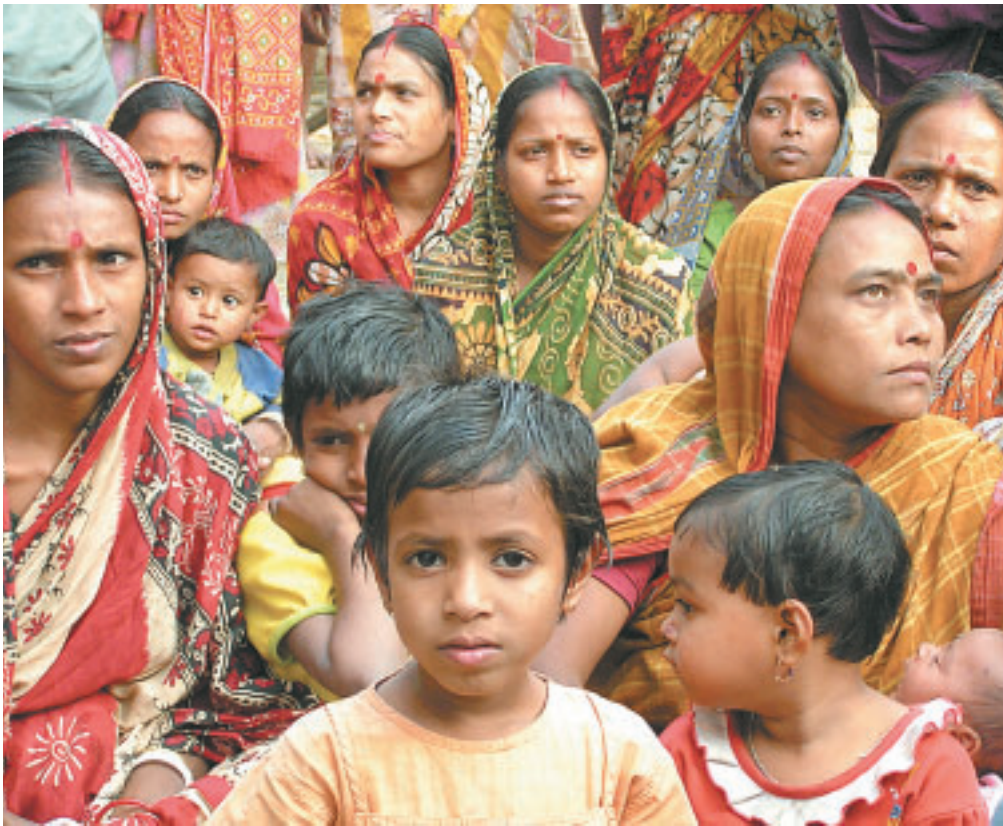
Aus Mitteln der Aktion Familienfasttag der Katholischen Frauenbewegung Österreichs werden Projekte zur Förderung von Frauen beispielsweise in Indien unterstützt.