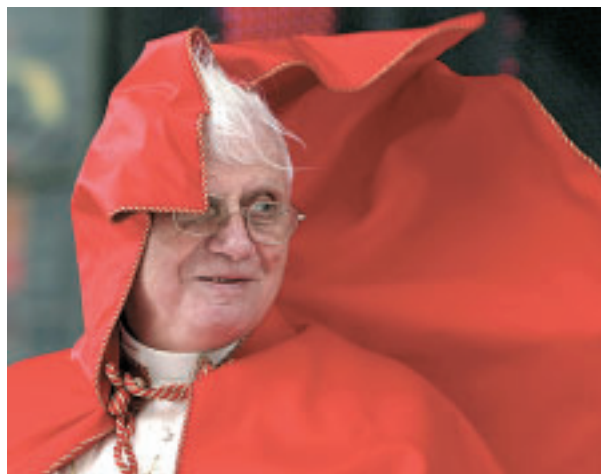
Stürmische Zeiten: Bevor der Papst entscheidet, muss er verlässliche Grundlagen bekommen, fordern Österreichs Bischöfe.

Auf Ortskirche hören. Bei der Suche geeigneter Kandidaten gibt es zwei unterschiedliche Verfahren, erläutert Rees. Beim sogenannten „abstrakten“ Verfahren erstellt die Bischofskonferenz alle drei Jahre eine Liste von Kandidaten, die Rom übermittelt wird. Daneben können auch die Diözesanbischöfe Namen in Rom nennen. Beim konkreten Verfahren, das nach einer Sedisvakanz oder bei einem bevorstehenden Rücktritt (Altersgrenze etc.) eingeleitet wird, kommt dem Nuntius eine zentrale Bedeutung zu (siehe Zur Sache). Da gebe es einen ziemlich breiten Spielraum, wie er zu dem Dreivorschlag kommt, den er nach Rom weitergibt. „Bei der Größe der Weltkirche aber ist es entscheidend, dass diese Informationen auch im Hinhören auf die Ortskirche zusammengetragen werden, dass sie verlässlich und umfassend sind, damit der Papst letztlich eine gute Entscheidung treffen kann“, betont Rees.