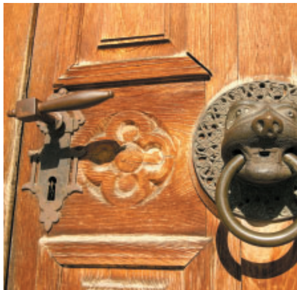
Das Interesse aneinander öffnet die Tür „zum Vertrauen, dass Gott im Leben der Menschen da ist und wirkt.“