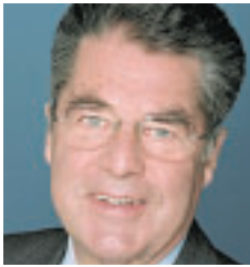
Bundespräsident Heinz Fischer verteidigt Religionsunterricht.