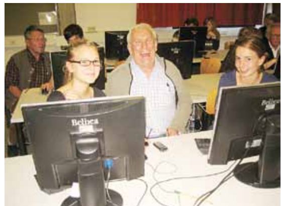
Spaß bei ALT.JUNG.-IT-FIT-SEIN