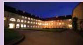
Bildungshaus St. Georgen