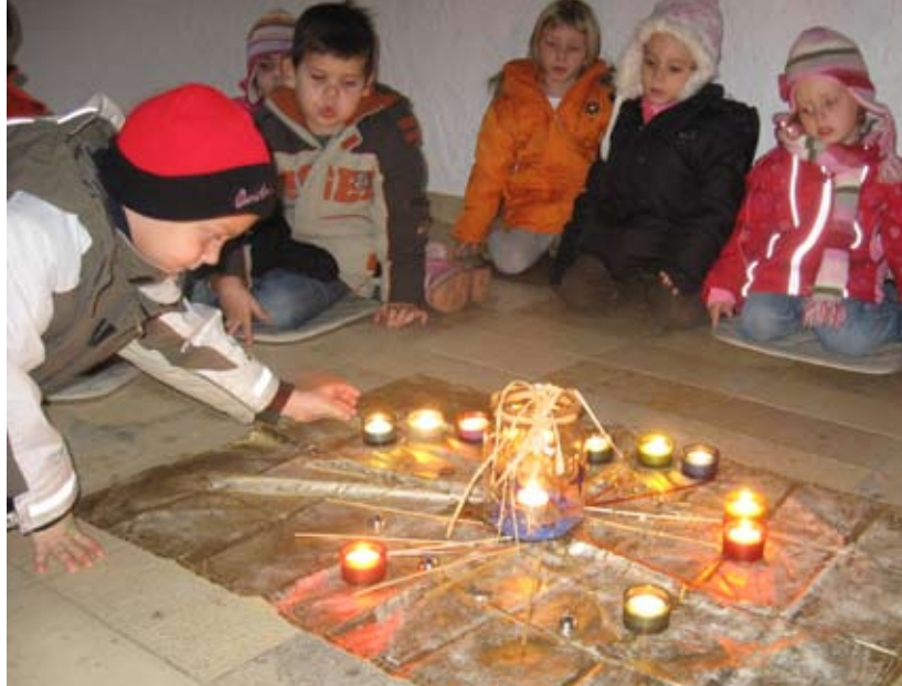
Advent im Kindergarten St. Franziskus. Die Feste werden gemeinsam gefeiert.

Reden gegen Ängste. Wir sind mit den Eltern viel im Gespräch, erzählt die Leiterin. Man muss die Inhalte der Feste erklären, denn Ängste gibt es oft aus Unwissenheit. Eine türkische Mutter hat zum Beispiel zum