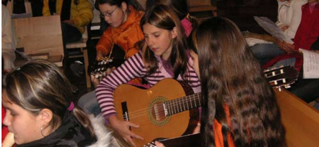
Hauptschüler/innen gestalten den Rorategottesdienst in Altenberg.