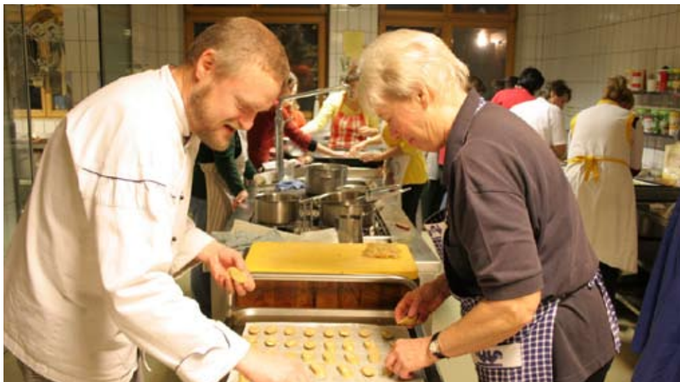
Beim Keksebacken geht es zwar nicht ganz so still zu, aber der franziskanische Geist ist zu spüren.