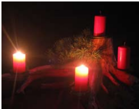
Die Adventwurzel im Haus der Stille will die Menschen zum Wesentlichen führen.