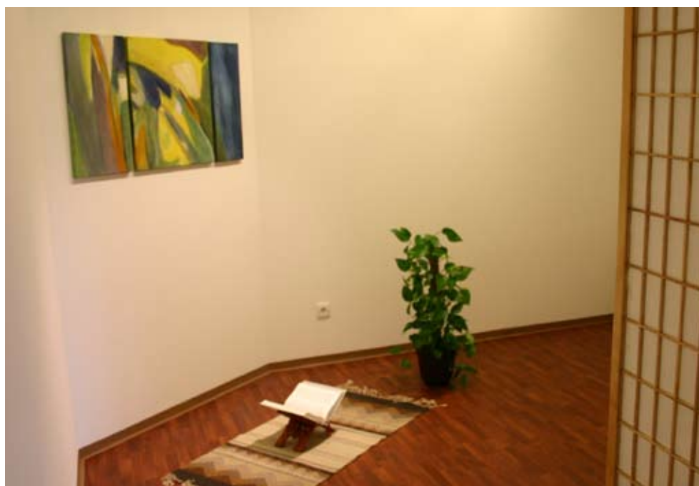
Der Raum der Stille ist im Trubel des Einkaufszentrums DEZ ein gesuchter „Brunnen der Ruhe“. KIZ

schen, psychische Probleme, aber auch der Wunsch, ein Kind taufen zu lassen oder zu heiraten kommen dabei zur Sprache. „Es gibt wenig Menschliches, was wir nicht zu hören bekommen. Dennoch sind wir keine psychosoziale Station, sondern so etwas wie eine erste Anlaufstelle. Wir haben daher auch keine Dauerklient/innen“, betont Busse. Eher zurückhaltend nehmen Angestellte das Gesprächsangebot wahr. „Denen sind wir wohl zu nahe am Arbeitsplatz“, meint Busse. „Dafür passiert es mir häufig, dass mich beim Einkaufen dann Angestellte unmittelbar anreden und mir von ihren Problemen erzählen. Sie wissen, dass ich vom ‚Brunnen‘ bin und haben daher auch das Vertrauen, dass unter uns bleibt, was sie mir sagen.“ ●